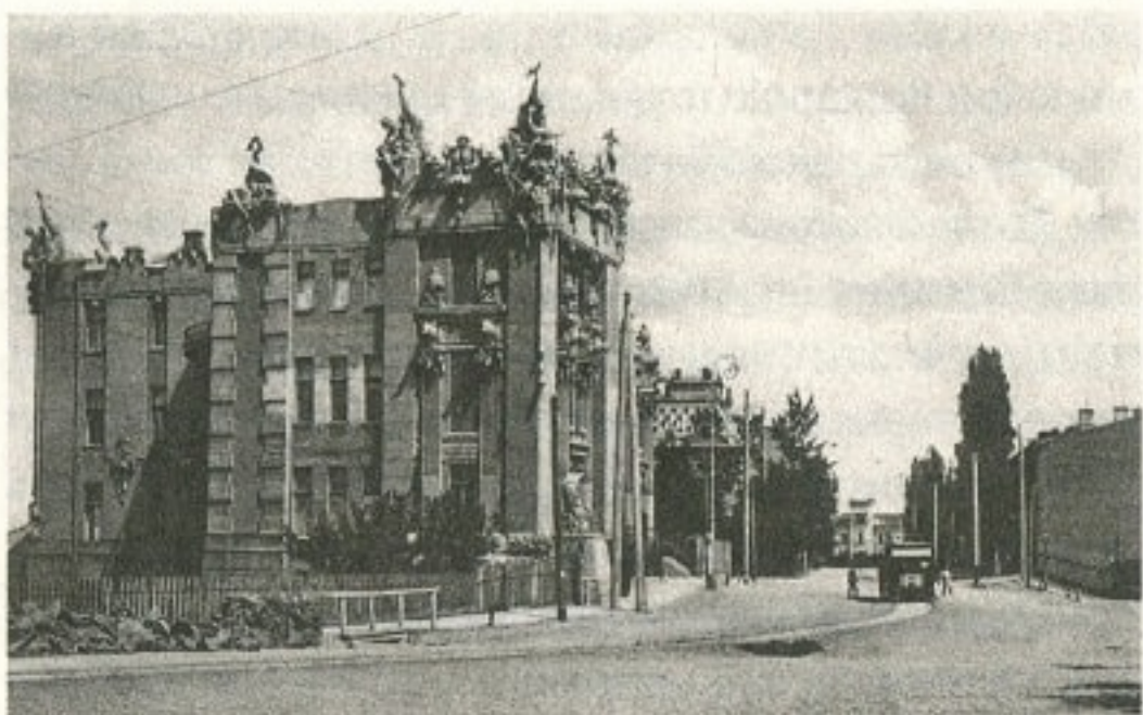
Вул. Банківська, 10

неспішно зростав новий костел, дозвіл на будівництво якого майже вісім років тому надала київська міська управа на прохання римо-католицької громади міста. Зводили його, можливо, не так швидко, як хотілося, але невпинно, аршин за аршином.