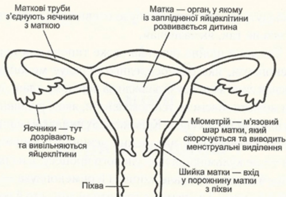
Жіноча репродуктивна система

який запускає вивільнення яйцеклітини з яєчника (овуляцію). Яєчник починає утворювати прогестерон та естроген, готуючи матку до можливої вагітності. Рівень цих гормонів зростає, натомість знижується рівень ФСГ і ЛГ. Якщо яйцеклітина не запліднюється, рівень прогестерону падає, починається менструація — і цикл повторюється.