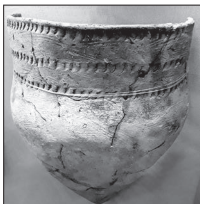
Посудина, знайдена у Деріївці

Занепад Трипільля, власне, і був викликаний насамперед кліматичними змінами. Дехто з нащадків трипільців залишив терени нинішньої України, дехто — археологи іменують їх усатівцями — намагався пристосуватися до нових обставин життя та облаштуватися в степах. Але нащадки середньостогівців, більш звиклі до степового життя, виявилися підготовленішими до випробувань, тому зрештою посунули усатівців, а можливо, й асимілювали їх.