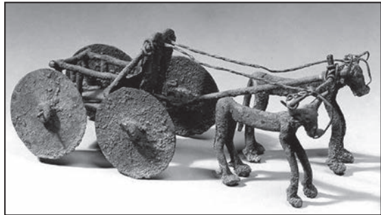
Віз ранньої бронзової доби, запряжений биками

Розселення індоєвропейців часто уявляють як загарбницькі походи або ж блискавичні війни з тубільцями. Проте вози, запряжені волами, не надто пристосовані для ведення бойових дій (шумери, щоправда, використовували вози у битвах, але запрягали до них віслюків). Тож міграції часів ранньої бронзи відбувалися радше мирно, навіть буденно й розтягнулися на