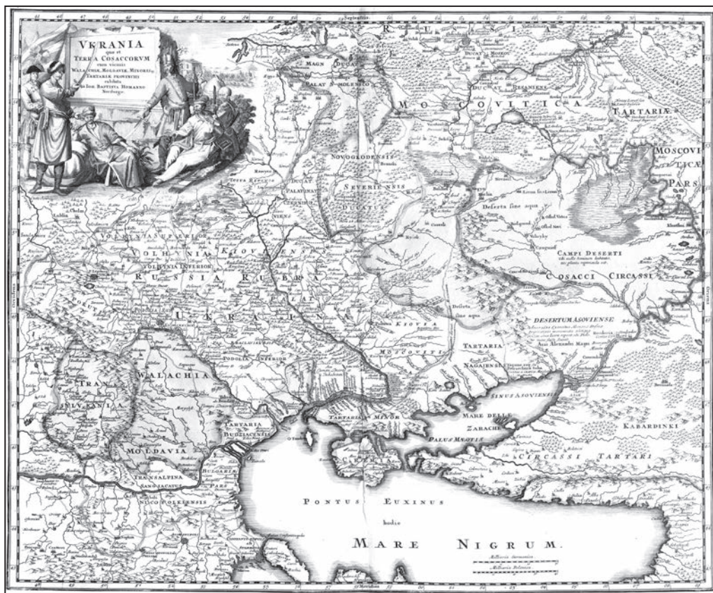
Причорномор'я на карті України XVIII ст.

(яке, щоправда, постійно «вислизає» з рук дослідників) та Русі, неодмінно Київської. І це при тому, що епіцентром подій щонайменше стародавньої, а значною мірою і середньовічної історії нашої країни була зовсім не Київщина чи Полісся (де, власне, й шукають це «ядро»), а степ і чорноморське узбережжя, які ми зараз із повним правом називаємо українським Півднем. Ліс і лісостеп, за всієї поваги до їхніх мешканців, століттями залишалися лише історичною периферією.