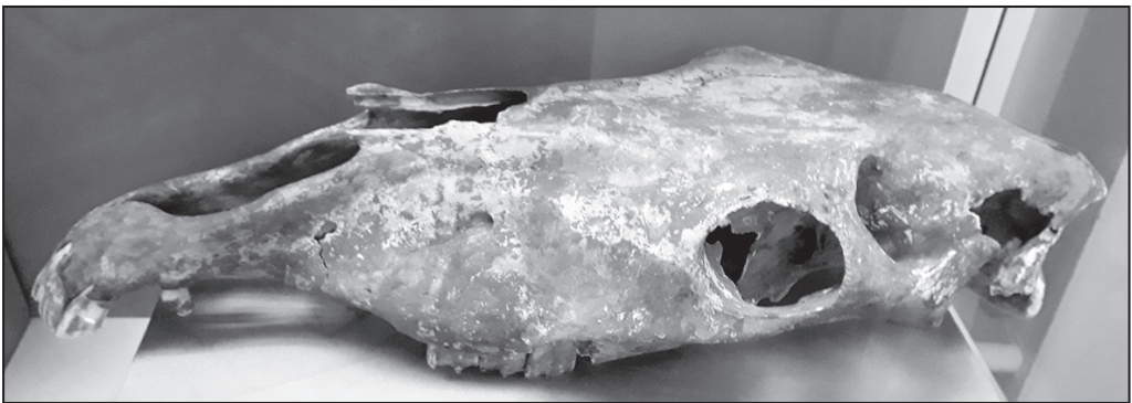
Череп коня з Деріївки

Безліч кінських кісток (їх було більше, ніж кісток будь-яких інших тварин), знайдених під час розкопок стародавнього селища біля Деріївки, зокрема й череп коня, який, вочевидь, використовували в ритуальних цілях, справили на археологів неабияке враження. Перший дослідник культури Дмитро Телегін вважав, що серед деріївських кістяних виробів є й псалії — частина вудил, а Марія Гімбутас на цій підставі припустила, що саме середньостогівці першими в історії приручили коня. Подальші дослідження цю гіпотезу, щоправда, не підтвердили, так би мовити, «за відсутністю доказів», тобто без категоричних заперечень. Цілком можливо, що середньостогівці лише полювали на коней або випасали їх у напівдикому стані (без загнудання) — заради їхнього м'яса. Але це, безумовно, був перший крок до одомашнення. І зміни природного середовища, що