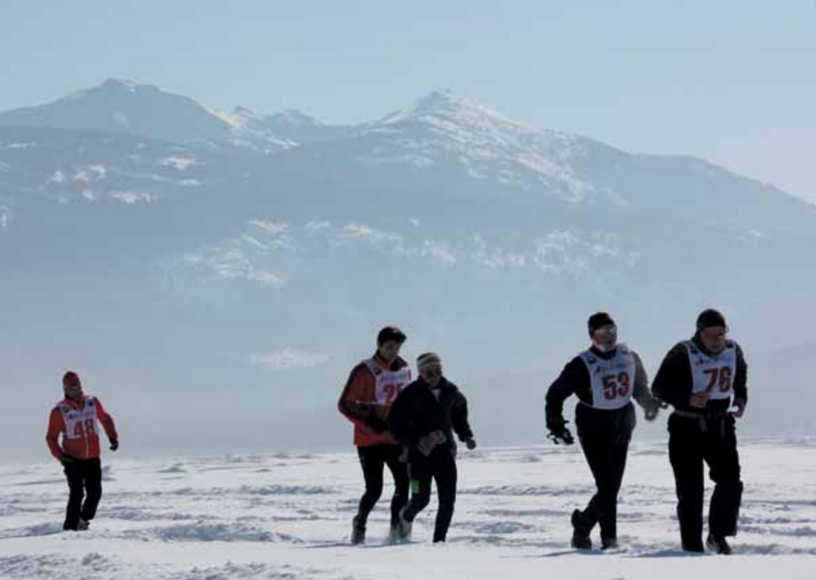
Вверху слева: Гонка в разгаре