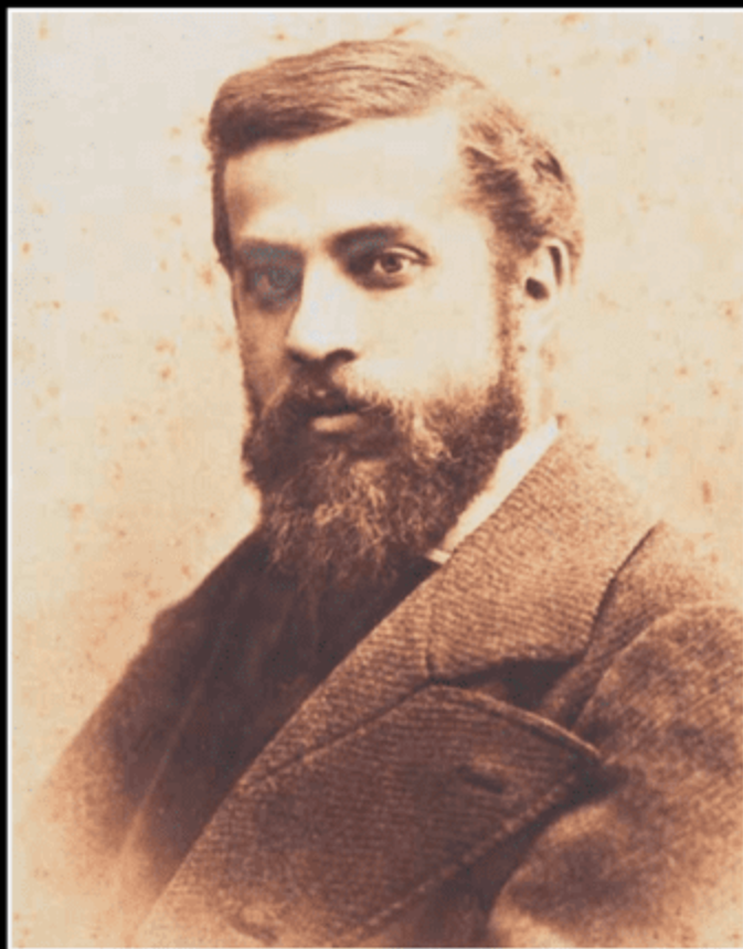
Портрет Антоні Гауді Пабло Аудуард Деглер, приблизно 1882 р.