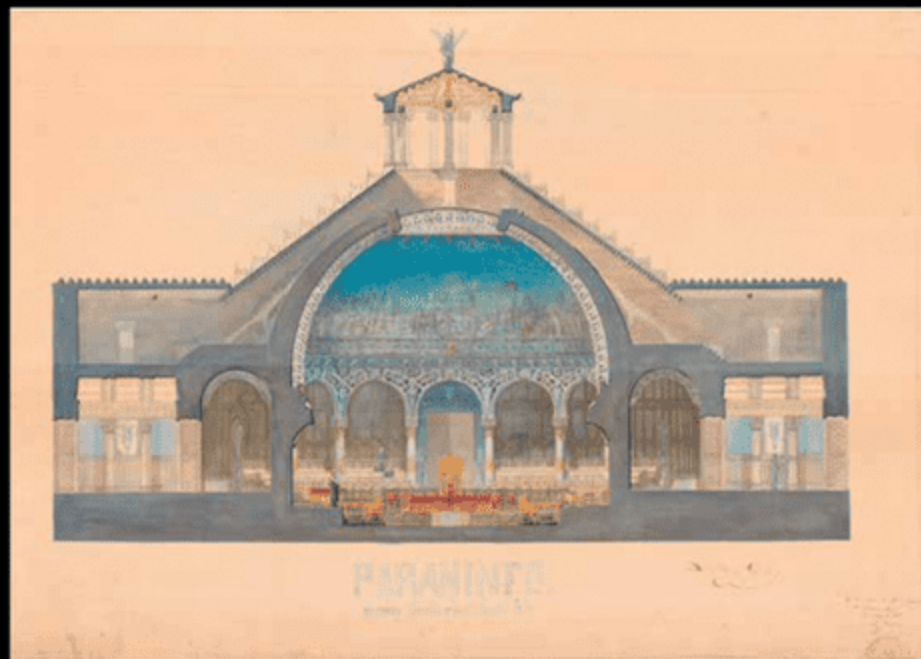
Проект університетської аудиторії для випускного іспиту Антоні Гауді, 1877 р.

У цей час Гауді вів щоденник, у якому записував, що його поглинає депресія. Навчання і робота однозначно допомагали йому, як він це називав, «позбутися неприємностей». Він працював не лише на Віара, а й на інших професорів, наприклад, Жоана Марторея, який навчав Гауді на початкових етапах його кар'єри і залишався його другом протягом усього життя.