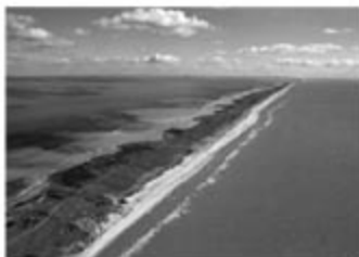
Вузька намивна смуга суходолу в морі, річці тощо, сполучена одним кінцем із берегом

— Як ви вважаєте, про яку косу ми будемо зараз говорити?