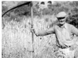
Сільськогосподарське знаряддя для косіння трави