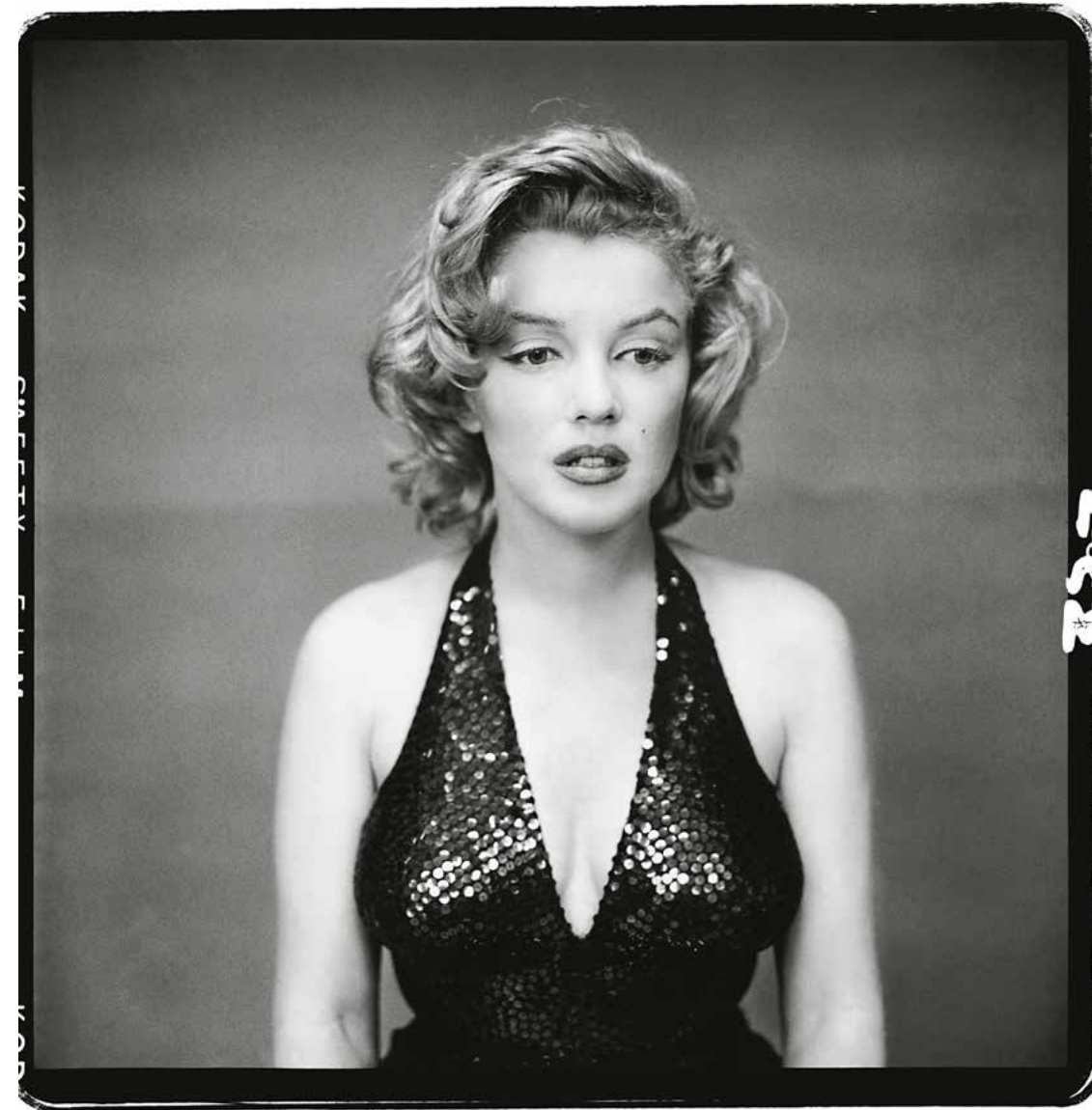
Мерилін Монро, акторка, Нью-Йорк, 6 травня, 1957

Завдяки майстерній здатності використовувати нюанси того, що на поверхні, – вираз обличчя, мову тіла, волосся, одяг і світло, – Аведон створив припущення щодо душевного стану своєї моделі. Щодо публіки, то Аведон добре знав, що ми схильні інтерпретувати ці припущення як факти, що потім спокушає нас бачити те, чого немає на фотографії, те, чого там ніколи не може бути: ауру людини, її психіку чи навіть те, що діється в її душі.