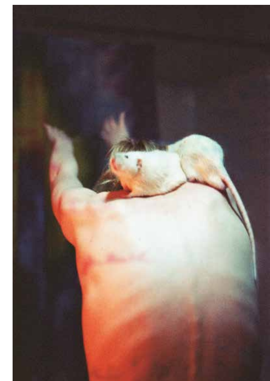
УГОРІ ЛІВОРУЧ: Каліфорнійський міраж, 2015