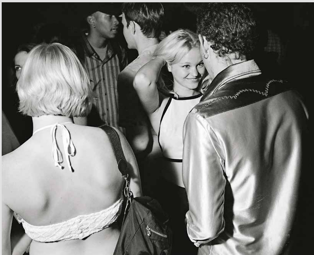
Без назви, із серії «У пошуках кохання», 1996

«Я полюбив фотографію, бо це був привід ходити всюди самому».