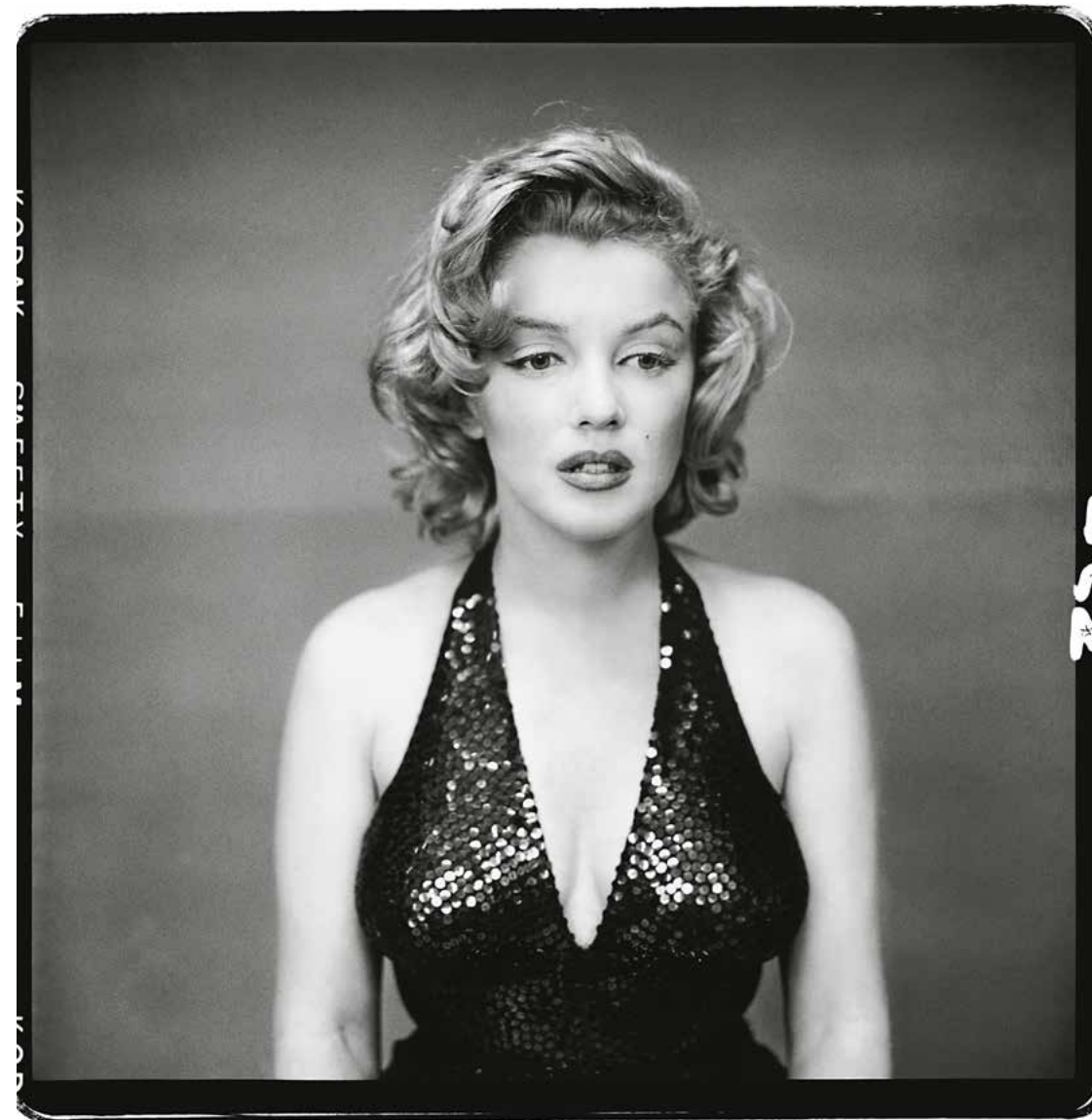
Мерилін Монро, акторка, Нью-Йорк, 6 травня, 1957

Завдяки майстерній здатності використовувати нюанси того, що на поверхні, – вираз обличчя, мову тіла, волосся, одяг і світло, – Аведон створив припущення щодо душевного стану своєї моделі. Щодо публіки, то Аведон добре знав, що ми схильні інтерпретувати ці припущення як факти, що потім спокушає нас бачити те, чого немає на фотографії, те, чого там ніколи не може бути: ауру людини, її психіку чи навіть те, що діється в її душі.