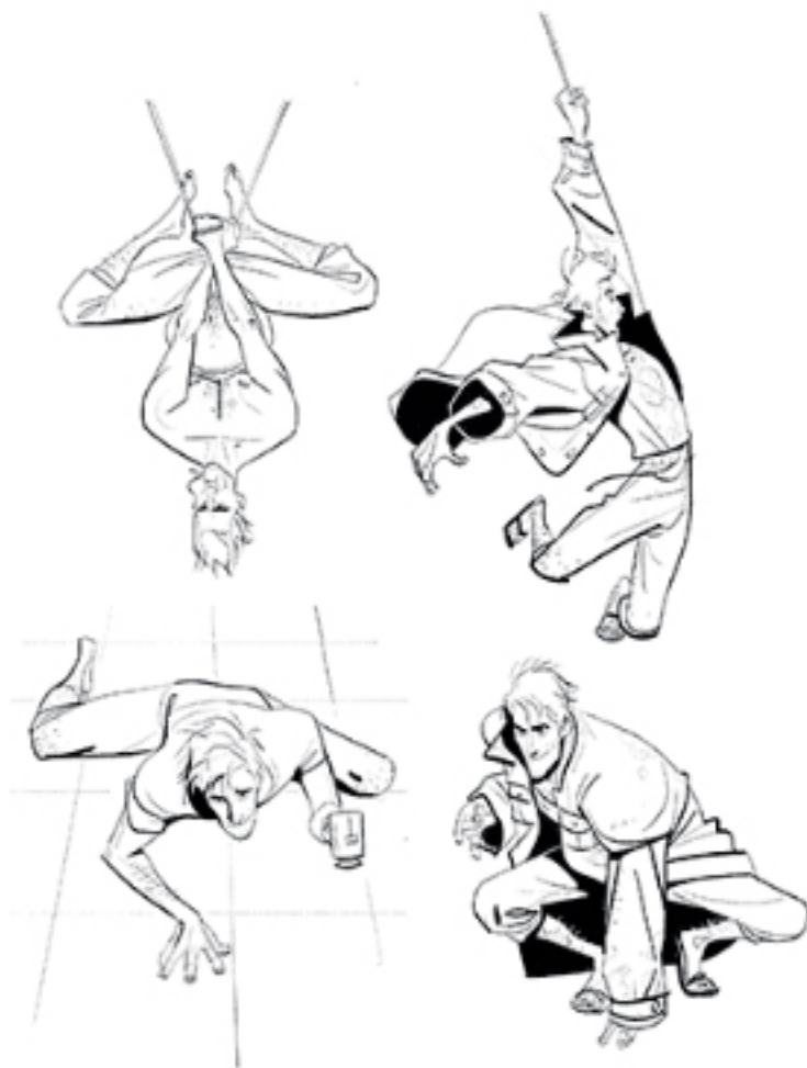
ЗГОРН: Скети, Шілан Кін. НАСТУЖКА СТОРІНКА: Ескай (зверху), Шілан Кін, Фіналмейн мопанок (знизу зліва) 2D-дизайн Шілана Кіна, 3D-дизайн Онура Сніта, колірне рішення Раба Раппеля, Молчанок (знизу справа) 2D-дизайн Шілана Кіна, 3D-дизайн Онура Сніта, колірне рішення Венцела Даліта.