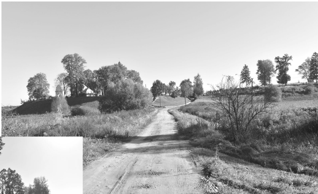
Околиці села Кам'янобрід. Сучасні світлини, 2022 рік