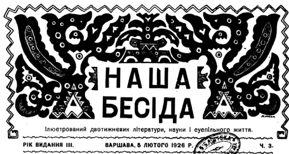
Петро Мегик. Графічний паспорт для часопису, 1926 рік