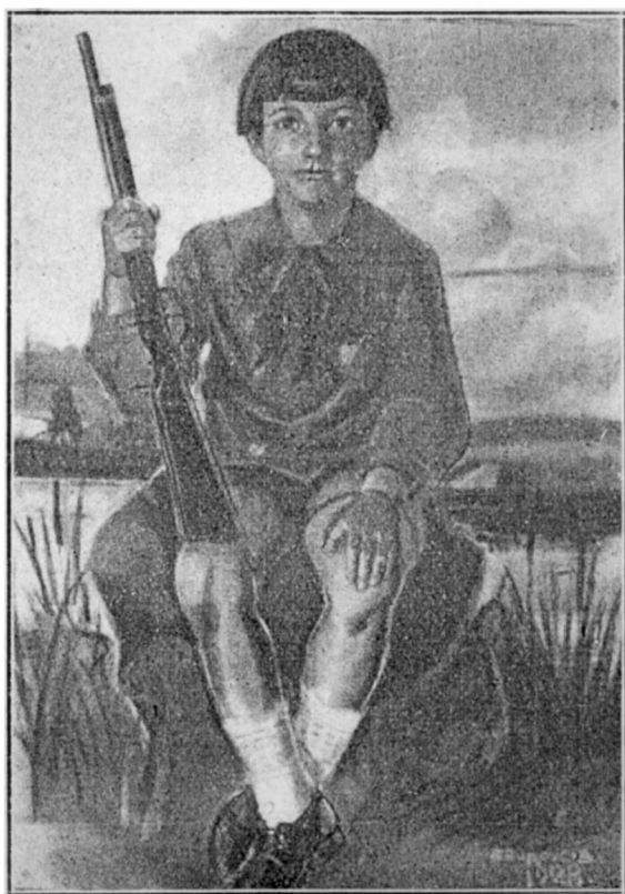
Петро Андрусів. Портрет хлопця. 1928.

була знаменитим підкладом до того, що вкоротці любов до свого Народу й Краю сталась нашим спільним кличем. Я віднайшов сам себе, віднайшов своє національне "я". Історія України розбуджувала вже тоді мою уяву і я вже тоді рішився посвятитись історичному малярству» 1 .