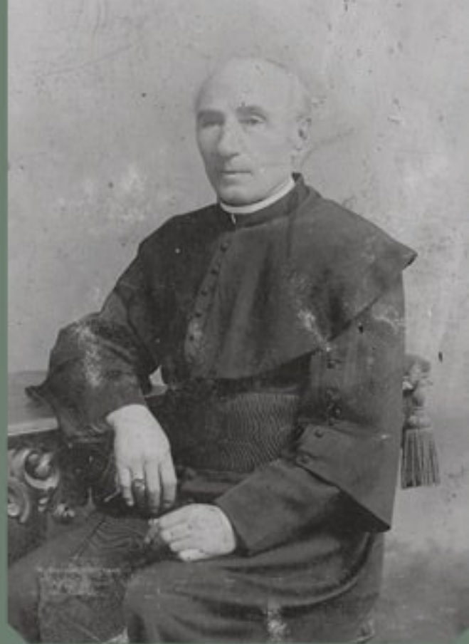
О. Дмитро Гузар (1823–1908)