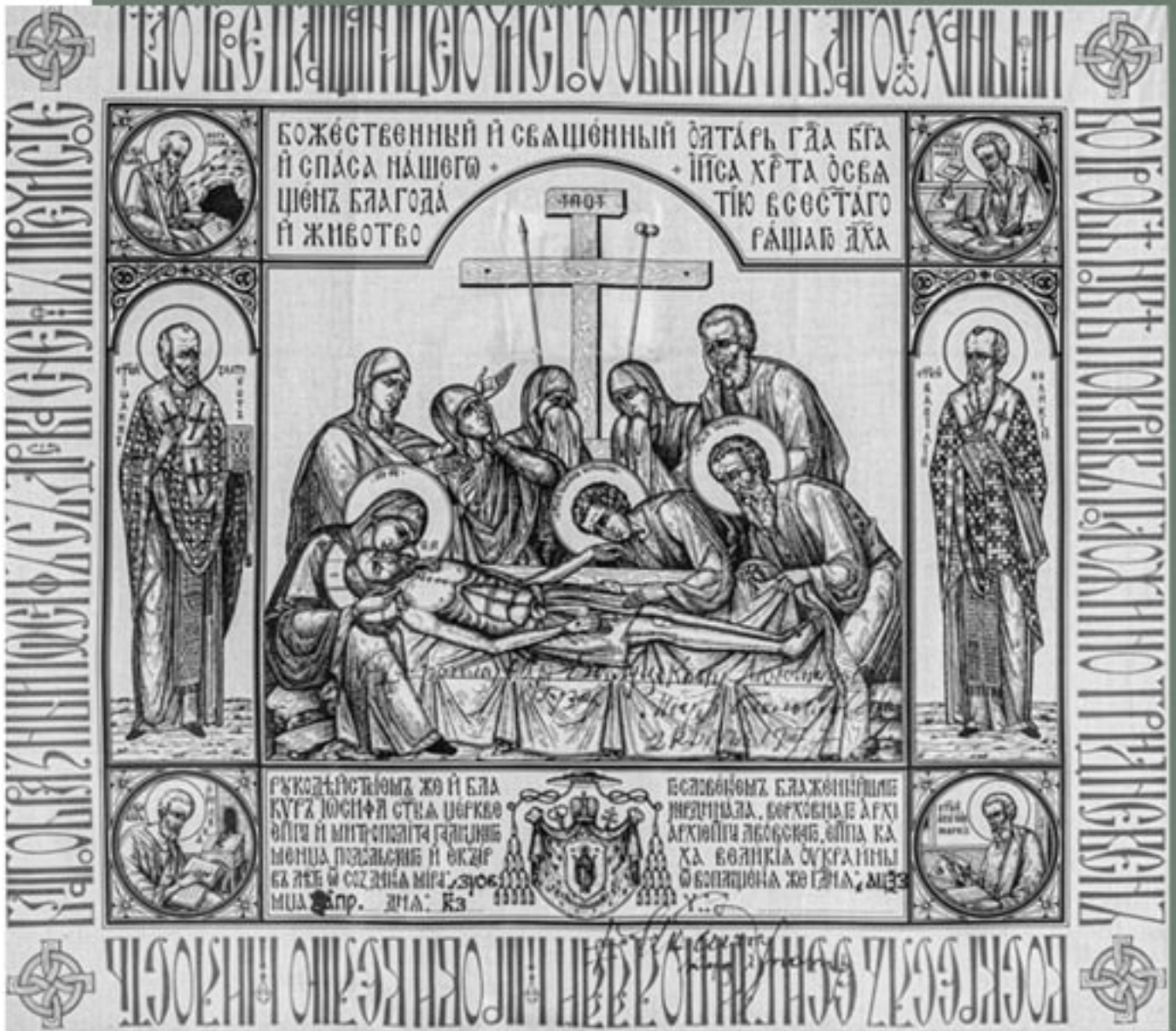
Антимінс владыки Любомира Гузара з підписом Блаженнішого Йосифа Сліпого