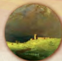
Фрагмент картини «Після дощу»

Тут молодий художник познайомився з двома вихідцями зі Слобожанщини — Іваном Крамським та Іллею Рєпіним. Усі троє художників з України працювали у стилі реалізму, який можна описати просто: зображуємо те, що бачимо. Реалісти не прикрашали світ, вони, буди портретистами доби, намагалися змалювати буденність. Така сама течія існувала в літературі, яскравою представницею якої в той час була Марко Вовчок, що описувала реалістичні історії зі щоденного українського життя. Утім, Куїнджі мало цікавився людьми, його вражала природа. Тому художник став майстерним автором пейзажу. Особливо вдало він писав місячні ночі та заходи сонця на тлі красивих українських річок. Митець тонко відчував колір, любив контрастне багряне сяйво на тлі непроникної пітьми. Водночас його денні картини пронизані особливим світлом, так наче художник міг бачити прозоре сонячне проміння. Воно особливо тонко відчувається в картині «Степ. Нива», а в роботі «Після дощу» можна побачити контраст грозового неба та смарагдового лану.