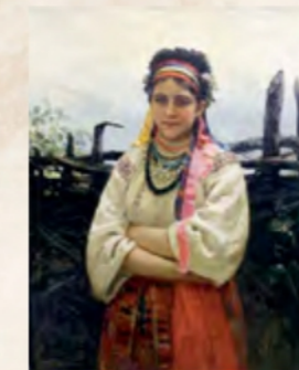
«Українка біля тину» (Латвійський національний художній музей)