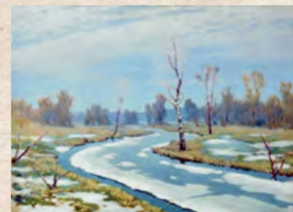
«Рання весна» (Харківський художній музей)