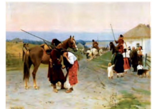
«В похід (Проводи козаків)» (Національний художній музей України)