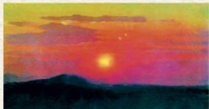
«Червоний захід» (2022 року викрадена з Художнього музею ім. Куїнджі, Маріуполь)