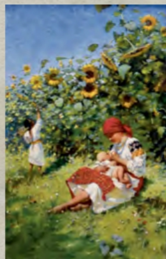
«Мати» (Національний музей у Львові ім. Андрея Шептицького)