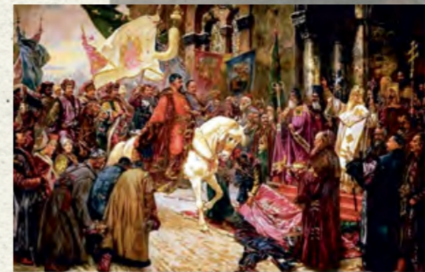
«В'їзд Богдана Хмельницького в Київ» (Національний художній музей України)