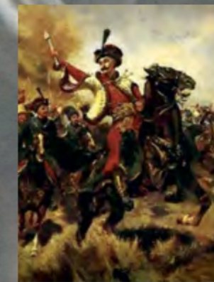
«Іван Богун у бою під Берестечком» (Національний музей у Львові ім. Андрея Шептицького)