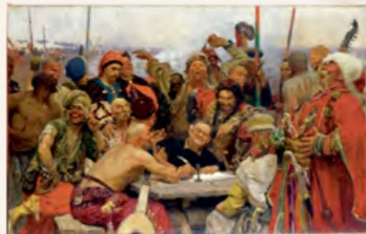
«Запорожці пишуть листа турецькому султанові» (друга версія) (Харківський художній музей)

Усе життя Репін звертається у своїй творчості до українських мотивів. Одна з його найвизначніших робіт — «Запорожці пишуть листа турецькому султанові». Для втілення свого творчого задуму художнику знадобилося 13 років: він вивчав одяг і зброю, шукав моделей, консультувався з істориком Дмитром Яворницьким, мандрував Україною.