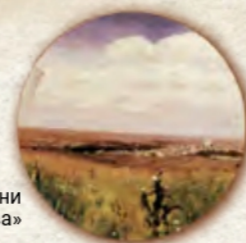
Фрагмент картини «Степ. Нива»