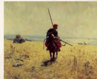
«Козак у степу» (Харківський художній музей)

Ілля Репін увійшов у світову культуру як російський художник, адже жив у часи російської імперії, яка зробила Україну своєю колонією, писав портрети імперської шляхти, а також створював роботи на тему історії росії. Утім, уся його творчість пронизана українськими мотивами, і чи не з кожної картини проглядає українська ідентичність. Бо тільки українці можуть так щиро сміятися і бути такими волелюбними, як козаки на полотні «Запорожці пишуть листа турецькому султанові». Тож час повертати своїх митців.