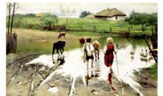
«Брід» (Одеський національний художній музей)