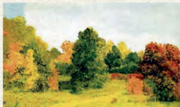
«Осінь» (2022 року викрадена з Художнього музею ім. Куїнджі, Маріуполь)

Тут молодий художник познайомився з двома вихідцями зі Слобожанщини — Іваном Крамським та Іллею Рєпіним. Усі троє художників з України працювали у стилі реалізму, який можна описати просто: зображуємо те, що бачимо. Реалісти не прикрашали світ, вони, буди портретистами доби, намагалися змалювати буденність. Така сама течія існувала в літературі, яскравою представницею якої в той час була Марко Вовчок, що описувала реалістичні історії зі щоденного українського життя. Утім, Куїнджі мало цікавився людьми, його вражала природа. Тому художник став майстерним автором пейзажу. Особливо вдало він писав місячні ночі та заходи сонця на тлі красивих українських річок. Митець тонко відчував колір, любив контрастне багряне сяйво на тлі непроникної пітьми. Водночас його денні картини пронизані особливим світлом, так наче художник міг бачити прозоре сонячне проміння. Воно особливо тонко відчувається в картині «Степ. Нива», а в роботі «Після дощу» можна побачити контраст грозового неба та смарагдового лану.