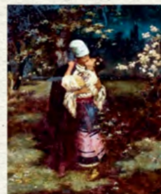
«Поцілунок» (Музей сучасного мистецтва України)

Тож хто зараз у Києві — гайда в Національний художній музей дивитися на велетенське полотно, де зображений великий гетьман. Там само ви зможете побачити роботи багатьох інших майстрів, про яких читаєте в нашій книжці.