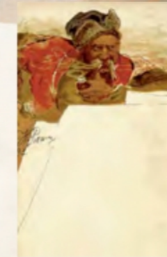
Перша українська різдвяна листівка