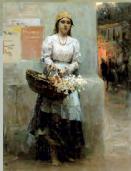
«Київська квіткарка» (Національний художній музей України)

Цей великий майстер змальовував буденне життя в українських містах і селах. Саме за картинами Пимоненка, як і за віршами Шевченка, ми можемо уявити, як жили українці півтора століття тому. Дуже часто Микола зображував українців за роботою, як-от у картинах «Сінокіс», «Київська квіткарка», «Дівчина з граблями», «Гуси, додому», «У затінку», «Жнива в Україні».