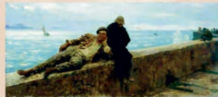
«Безпритульні» (Одеський національний художній музей)