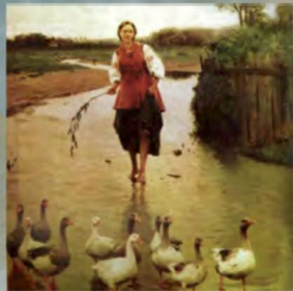
«Гуси, додому» (приватна колекція)

Може, вам здасться це трохи дивним, але історики стверджують, що нації у сучасному їхньому вигляді сформувалися не так давно, а саме в XIX столітті, менш ніж 200 років тому. До того мешканці різних країн не надто розглядали себе й інших крізь призму нації. Звичайним людям важливішою була їхня віра, соціальний стан і належність до певної громади. Але два століття тому люди почали відчувати єдність зі своїми земляками, які говорять тією самою мовою, мають схожий побут і традиції. Це відчуття підхопили митці, які почали формувати національну культуру, окреслюючи властиві їй риси. В українській літературі найяскравішою особистістю періоду формування націй став Тарас Шевченко, у музиці — Микола Лисенко, а в образотворчому мистецтві — Микола Пимоненко.