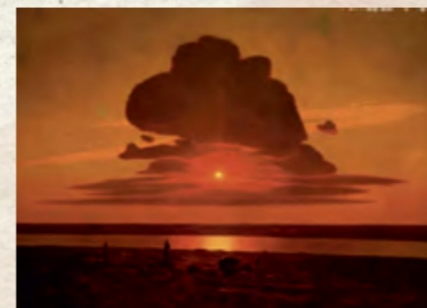
«Червоний захід сонця» (Музей мистецтва Метрополітен, Нью-Йорк)