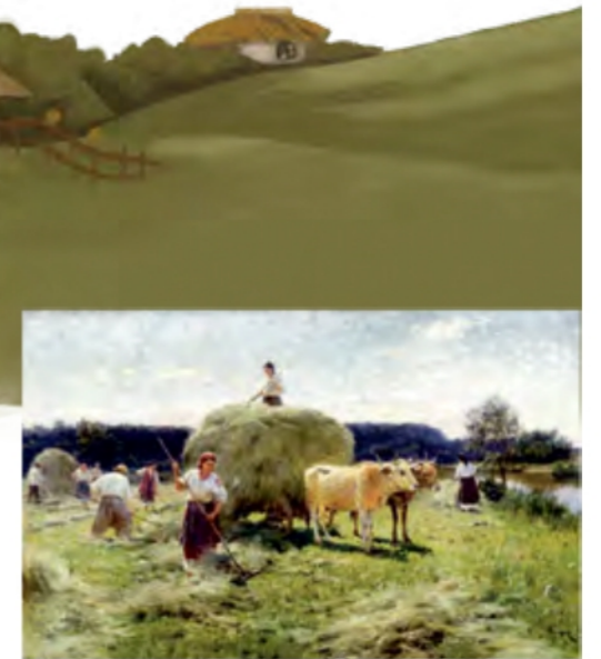
«Сінокіс» (Харківський художній музей)

Є художники, які вміють відкривати свій багатий внутрішній світ, є такі, які створюють фантастичні світи, а Микола Пимоненко своєю художньою творчістю проник у душу рідного народу. Микола Пимоненко був великим ловцем сонячного світла, та важливіше те, що він умів спіймати людське світло, яким сяють персонажі його знаменитих картин.