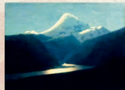
«Ельбрус» (2022 року викрадена з Художнього музею ім. Куїнджі, Маріуполь)

Сумно згадувати про цього митця в контексті сьогоднішньої війни, адже росіяни під час обстрілів Маріуполя знищили музей Архипа Куїнджі та викрали три роботи видатного художника — «Червоний захід», «Осінь» і «Ельбрус». Утім, немає жодного сумніву, що ми підіймемо наш стяг над Маріуполем, відбудуємо музей видатного українця грецького походження і повернемо все вкрадене.