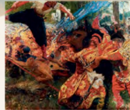
«Гопак» (приватна колекція)

1900 року Репін разом із дружиною Наталією Нордманн переїхали в садибу «Менати» (45 км від Петербурга). Там вони жили особливим життям: дотримувалися вегетаріанської дієти, приймали гостей лише в середу, спали з відчиненими вікнами навіть у мороз, не мали прислуги, поралися на городі. Після Жовтневого перевороту на російії 1917 року величезна, у якуму вони жили, перейшло до Фінляндії. Репін відмовився переїжджати до Радянського Союзу й до кінця життя прожив у Куоккалі. В останні роки життя в нього відмовила права рука, але він навчився малювати лівою.