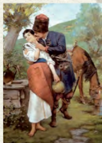
«Біля криниці» (Національний музей у Львові ім. Андрея Шептицького)

умістити цю картину. Сьогодні ця робота є однією із найбільших окрас Національного художнього музею України в Києві.