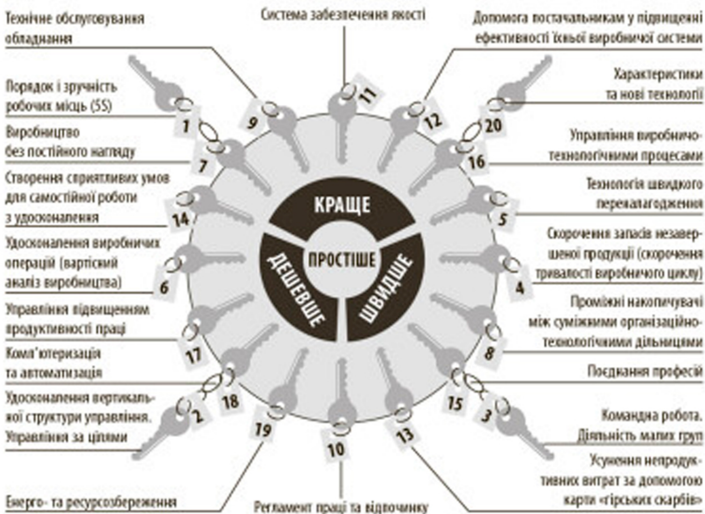
20 ключів до вдосконалення бізнесу