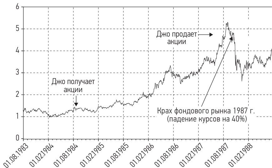
Рис. 1.1. Бурный рост и резкое падение курса акций Wal-Mart, 1983–1988 гг.