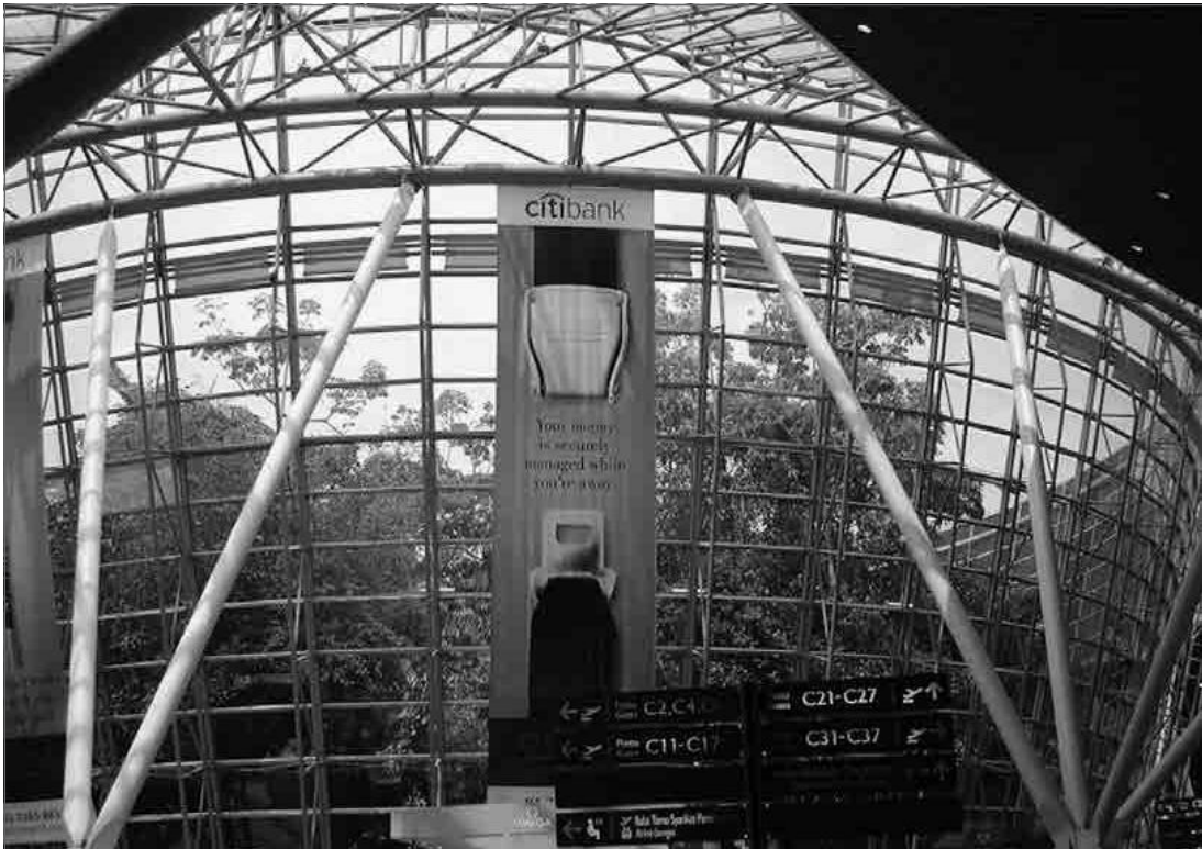
3.9. Міжнародний аеропорт у Куала-Лумпурі (KLIA)