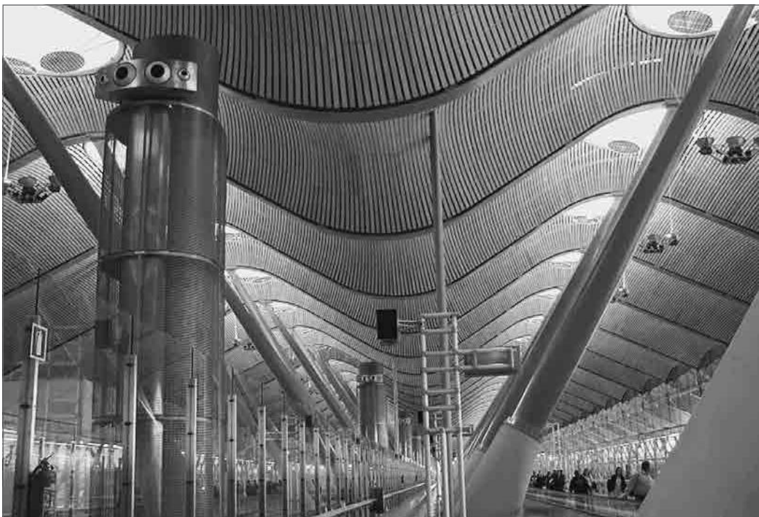
3.10. Барахас Мадрид