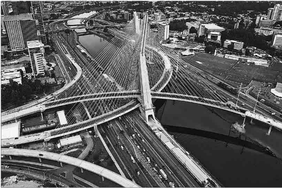
3.6. Натхненний роботами Калатрави міст у Сан-Паулу, Бразилія