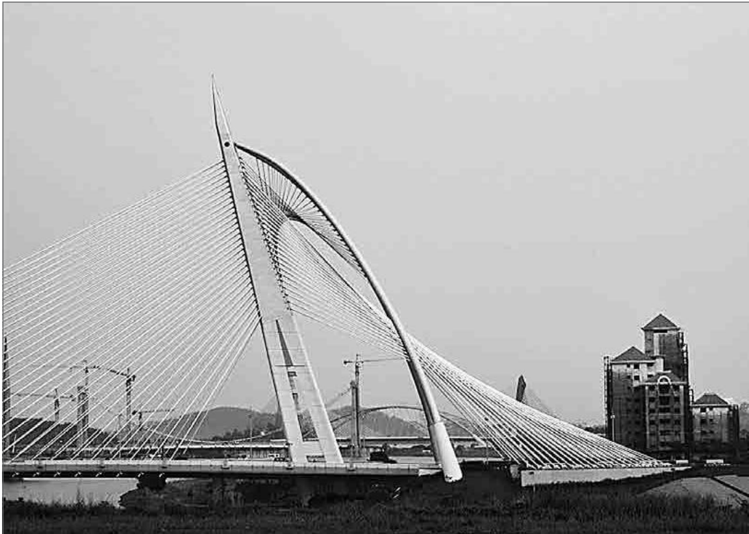
3.7. Натхненний роботами Калатрави міст у Путраджаї, Малайзія