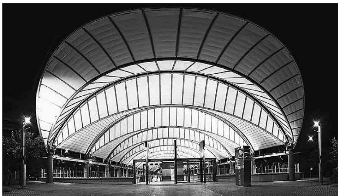
3.5. Залізнична станція Олімпійський парк у Сіднеї

Компанія Hassell, заснована в Аделаїді у 1938 році, мала найвищі гонорарні заробітки в Австралазії у 2014 році і вперше увійшла до списку BDWA 2014 на 25-му місці. Hassell спроектували станцію Олімпійський парк у Сіднеї — варіацію на тему скляних тентів, які нині прикрашають залізничні вокзали по всьому світу, вдалу типову місцеву ікону, за яку вони отримали національну нагороду від Австралійського інституту архітекторів (зображення 3.5). Найбільш примітний з останніх проєктів компанії — ресторанний комплекс «Пальмовий