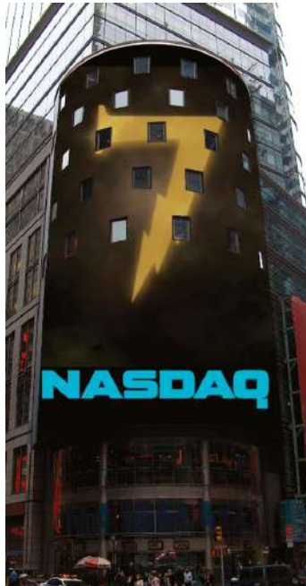
Фото з Таймс-Сквер, м. Нью-Йорк

«Ми придумали для цієї кампанії виразну естетику на основі певного типографського знаку, який планували використовувати у всіх контекстах, від друкованих плакатів і закладок для книжок до інтерактивних медіа й онлайн-застосунків», — каже Даг Бартоу, дизайнер і артдиректор id29.