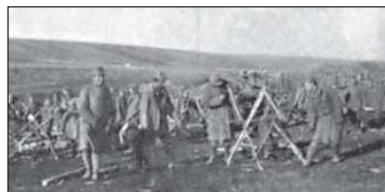
Легіон УСС над Стрипою

( За волю України: Історичний збірник УСС. 1914–1964 / За ред. С.Ріпецького. — Нью-Йорк: Червона Калина, 1967. — С. 417–418. )