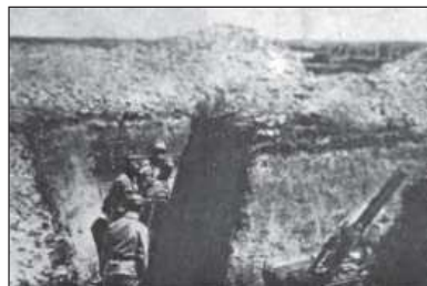
Міномет у стрілецьких окопах на позиції «Весела» на Теребовлянщині

2. Від дня 18-го вересня лучається вже другий случай підозріння про червінку. Заразки находяться в людських відходах, тому належить звертати