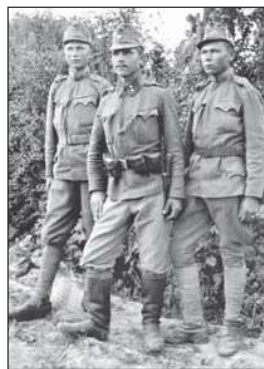
Українські січові стрільці. Поділля, 1916 р.

( За волю України: Історичний збірник УСС. 1914–1964 / За ред. С.Ріпецького. — Нью-Йорк: Червона Калина, 1967. — С. 418. )