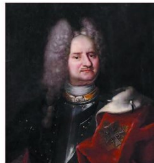
Портрет Єжи Александра Любомирського (пізніше 1735)

Основою герба Любомирських є Шренява, що бере початок в XI столітті та пов'язана з перемогою, здобутою біля однойменної річки за часів першого короля Польщі Болеслава Хороброго. Династія зробилася відомою на межі XV й XVI століть, коли Фелікс Любомирський заснував княже відгалуження роду (це високе походження символізує корона, що вінчає собою герб). Рід володів Рівним понад два століття — аж до початку Другої світової війни.