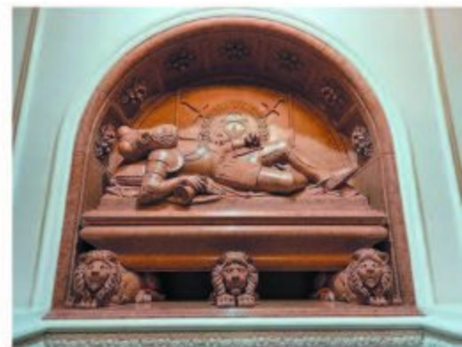
Відновлений надгробок князя Костянтина Острозького в Успенському соборі Києво- Печерської лаври

Коли у твоїй власності сотні містечок і сіл, виникає потреба якось упорядкувати і десь зберігати цю інформацію. Тож Острозькі скрупульозно записували кожен належний їм населений пункт до спеціальних книг. Одна з них дійшла до наших днів. Завдяки детальному опису Рівненського