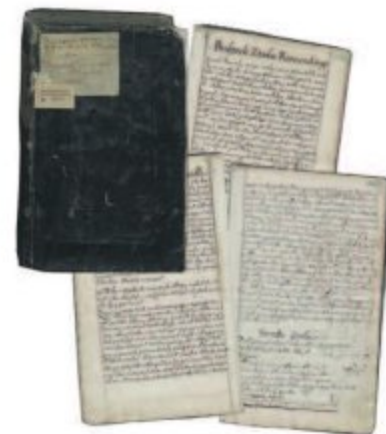
Інвентарна книга князів Острозьких 1620 року (обкладинка та сторінки з описом Рівненського замку)