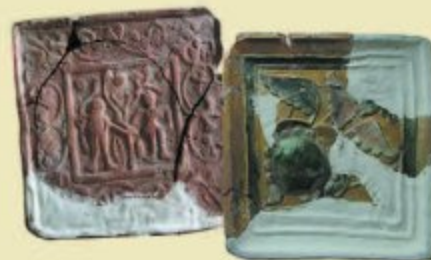
Кахлі з фондів Рівненського обласного краєзнавчого музею з постатями Адама та Єви й рослинним орнаментом

Особливо цікавими видаються кахлі, якими було оздоблено замкові груби. На них зображено біблійні сюжети, а деякі містять унікальні квіткові орнаменти.