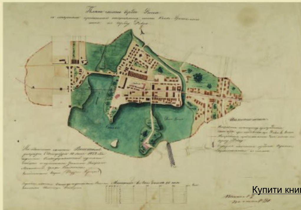
План частини Рівного середини XIX століття

розвивалося. Це були часи, коли більшість українських земель входили до складу Великого князівства Литовського, Руського і Жемайтійського.