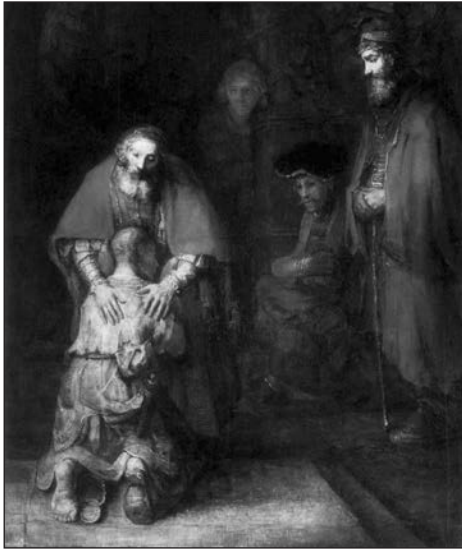
Рембрандт Харменс ван Рейн Повернення блудного сина

Щоб примирити людство з Богом, Ісус був готовий до вічної розлуки зі Своїм Отцем і до вічної смерті, на що нам вказує Його слово: «Звершилось!»