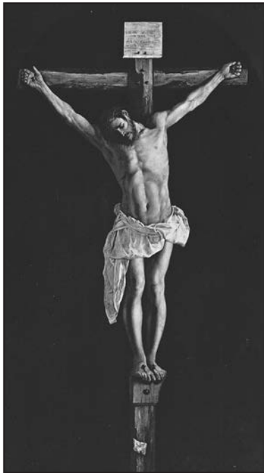
Франціско де Сурбаран. Розп'яття.

Одним з найуспішніших тренерів в історії професійного футболу був Вінс Ломбардії, який тренував команду Грін Бан Пакерс. Якось журналіст запитав футболістів: «Чому ваша команда так сильно відрізняється від інших? Чому ви так викладаєтесь?» Гравці відповіли: «Бо ми граємо не для натовпу, що зібрався на стадіоні, і не для мільйонів глядачів, що зібралися біля екранів телевізорів. Ми граємо тільки для одного — для тренера. Коли проглядаємо запис гри вранці у понеділок, то хочемо знати, що наша гра сподобалася тренерові». Так і справжні християни живуть не для натовпу, а для того, щоб своїм життям зробити приємне Отцеві Небесному. Ми маємо жити і працювати заради Бога і свого ближнього.