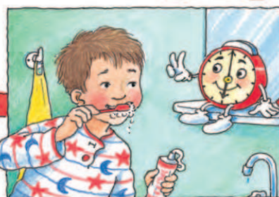
А ще я знадоблюся тобі у ванній кімнаті: адже зуби треба чистити три хвилини!