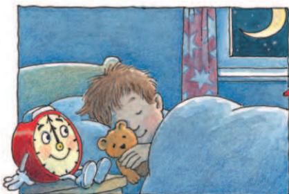
Хто йде і не спить цілу ніч, коли ти заплюєш очі?

Хто подає тобі сигнали часу, коли потрібно? Звісно, будильник! Довіряй мені: я можу контролювати час!