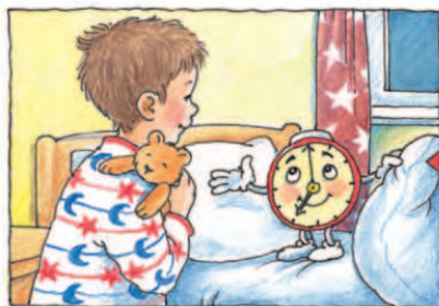
Глянь на мене: тобі вже пора лягати в ліжко!