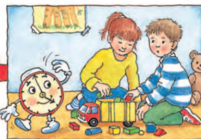
Хто каже: «Шкода, але час для ігор закінчився?»