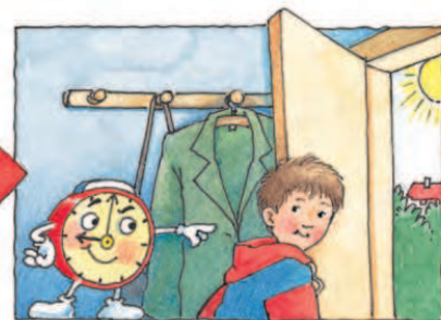
Хто вчасно відправляє тебе в дорогу? Поспішай, бо запізнишся!