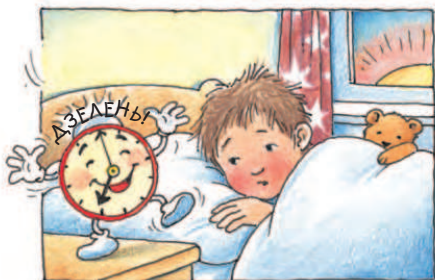
Кому так приємно піднімати тебе з ліжка майже щоранку?

нагадують календарі. Годинники та календарі вимірюють час, який ми поділяємо на великі й малі періоди: роки, місяці, тижні, доби, години, хвилини і секунди. Серед цих періодів є три, які можна вважати небесним годинником: це доба, місяць та рік.