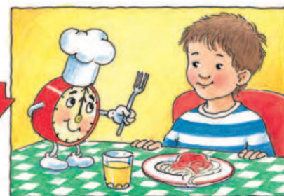
Зараз пора обідати. Без мене ти про це забуваєш!