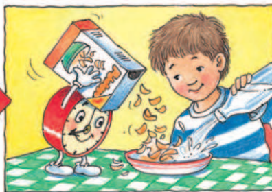
Хто планує й організовує твій час, нагадуючи тобі: вже пора?