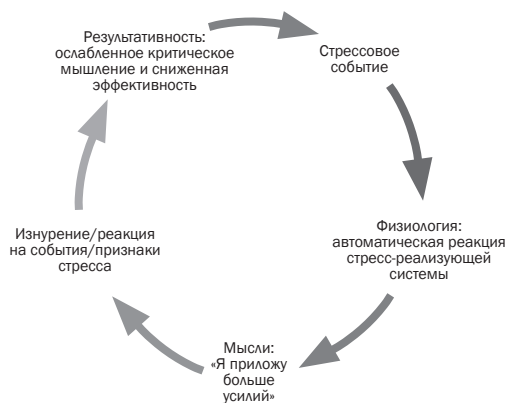
Рис. 1.1. Низкая стрессоустойчивость

Smart People Underperform («Когда система перегружена: почему преуспевающие менеджеры не могут работать в полную меру своих способностей»): «Бедняга сталкивается не с одним кризисом, а... с бесконечным потоком ситуаций, каждую из которых он воспринимает как небольшой кризис. Ощущение, что вы в западне, и желание соответствовать собственным стандартам и ожиданиям окружающих приводят к тому, что вы сжимаете волю в кулак, терпите и не жалуетесь — работы становится все больше, а результативность продолжает падать. Ваша реакция — “Я приложу больше усилий”. Вас не покидает чувство вины и легкой паники. Число задач растет как снежный ком, и на работе у вас постоянный аврал. Вы становитесь резким и нетерпимым, не можете сконцентрироваться ни на одной задаче, но продолжаете притворяться, что все в порядке... Вы настолько привыкли быть всегда “наготове”, что уже не замечаете того, что ваши механизмы приспособления попросту не работают» 1 . Если в последнее время на вас обрушилась лавина больших и маленьких дел, а вы при этом говорили себе: «Остановите поезд, я хочу сойти», то теперь вы знаете причину.