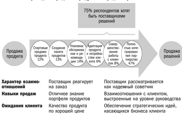
Рис. 1.1. Переход от продажи продукта к продаже решения