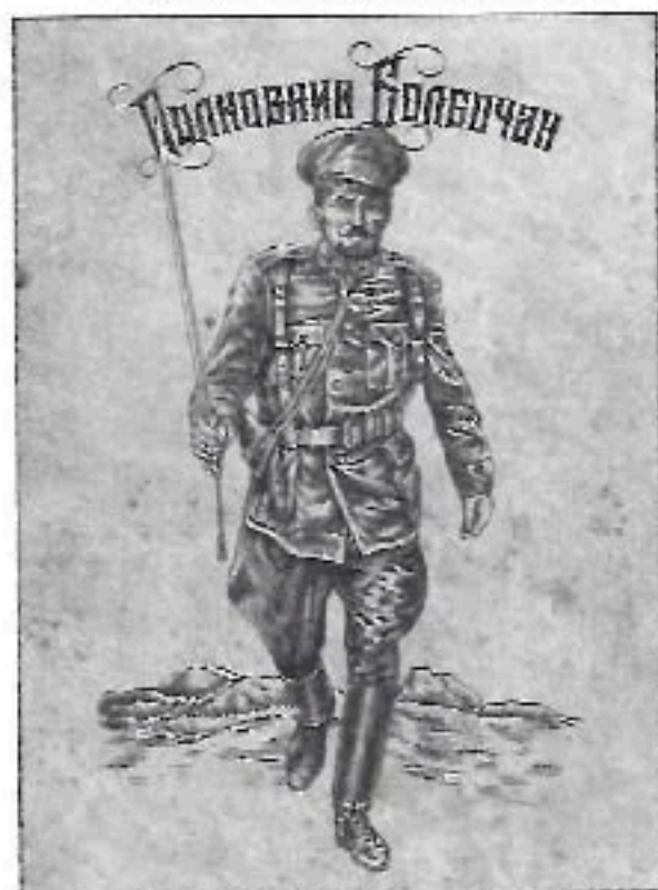
Андрій Сромолєнко, "Полковник Болбочан".