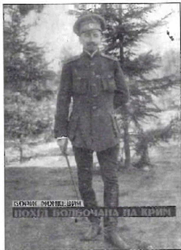
Обкладинка книги Бориса Мохоріна "Похід Болбочана на Крим". Липень 2014 р.