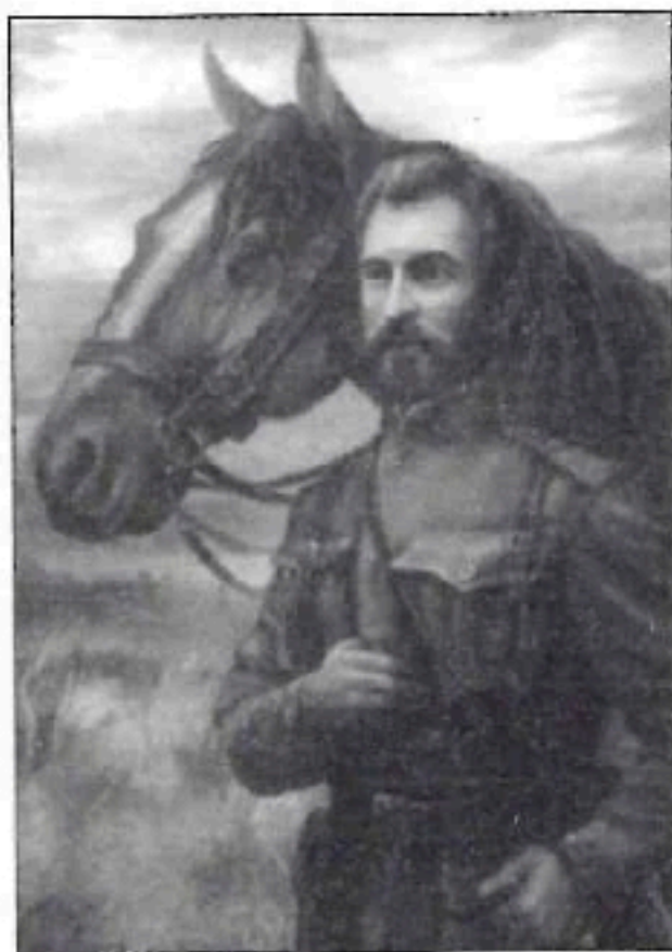
Невідомий художник, "Петро Болбочан".