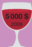
Шато Мутон- Ротшильд 1945