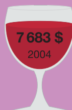
Пенфолдс Гранж Эрмитаж 1951