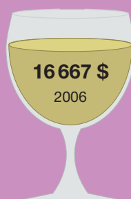
Шато Икем 1787