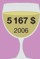
Роял де Мария 2000