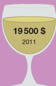
Шато Икем 1787