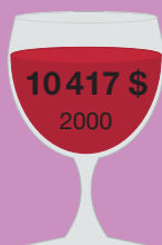
Каберне Скримин игл 1992