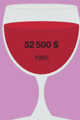
Шато Лафит 1787