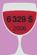
Шато Шваль Блан 1947