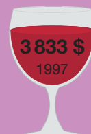
Шато Мутон- Ротшильд 1945