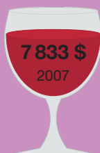
Шато Мутон- Ротшильд 1945