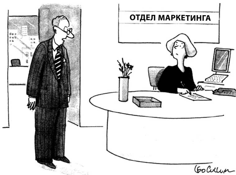
Рис. 1.1. «Переадресуйте звонки. Я спущусь в бухгалтерский отдел поиграть мускулами»

Лучшие бизнес-школы готовят своих слушателей к занятию руководящих должностей в сфере маркетинга, хотя на своей первой работе эти люди, возможно, были всего лишь второстепенными помощниками по маркетингу торговой марки в какой-нибудь крупной компании, производящей продукты питания или мыло. Поэтому в основу учебного курса кладется раз-