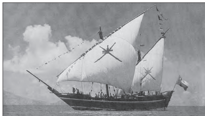
Арабське дхау з латинськими вітрилами – корабель Синдбада

остаточно уподобивши його до крила пташки. Цей логічний крок майже одночасно зробили і греки та римляни на Середземному морі, й араби та індуси в Аравійському морі, попри деяку відмінність у формі вітрил. Латинським, а не арабським, ми його називаємо з тієї ж причини, чому цифри «арабські», а не «індуські». У кого першого побачили, так і назвали.