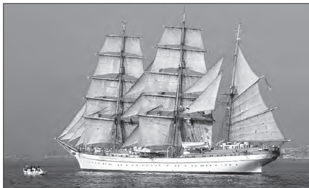
Прямі вітрила барка «Товариш», п. Херсон

Мені не траплялися згадки, чи могли вони поєднувати веслування й вітрило одночасно, але тепер на гребно-парусних шлюпках це вважають моветоном, і так роблять тільки салаги: щось одне. Йдуть або НА веслах, або ПІД парусом. Думаю, це такий самий давній звичай, як грецьке слово «парус», котре ми успадкували безпосередньо від винахідників цієї технології, яку приписують легендарному Дедалові. Перед винайденням дельтаплана він намагався втекти з Криту під вітрилами. Ну, воно й логічно: хтось має вибирати усі ті браси, шкоти й фали замість навалюватися на весла. А в ходовий вітер весла лише гальмують і «ловлять лящів» на хвилях. Утім, останній вираз, найімовірніше, вже наш, дніпровський. Бо в морі лящів нема. Повертаючись до теми вітрил – на руських лодях і запорозьких чайках вони теж були прямі.