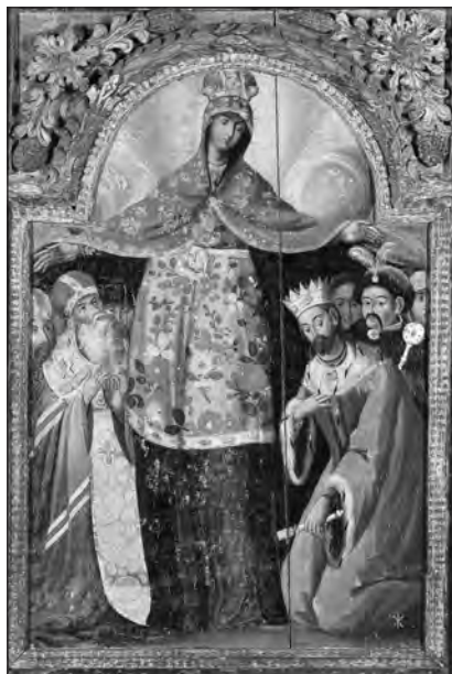
Покрова Пресвятої Богородиці. Козацька ікона 17 – поч. 18 ст., Національний художній музей України

Спів муедзинів прив'язаний до астрономії. Ні течії, ні глибини з того часу не змінилися. Зуб даю, саме тут стояли на якорях і флоти візантійських дромонів, перш ніж зайти у Босфор, і, ховаючись за мисами від зустрічної течії, повеслувати в уславлену бухту Золотий Ріг. Як ви, мабуть, здогадалися, якорі на дромонах вже були, і навіть залізні. Про це свідчать затонулі на озері Немі в Італії плавучі палаци (нині ми би сказали суперяхти) імператора Калігули (37–54 рр. н. е.). Якорі вже були навіть не дерев'яні з бронзовим штоком, як практикували греки, а повністю залізні, ковані. Я б навіть сказав – цілком адміралтейські. Сотні таких знаходять водолази на стамбульському рейді.