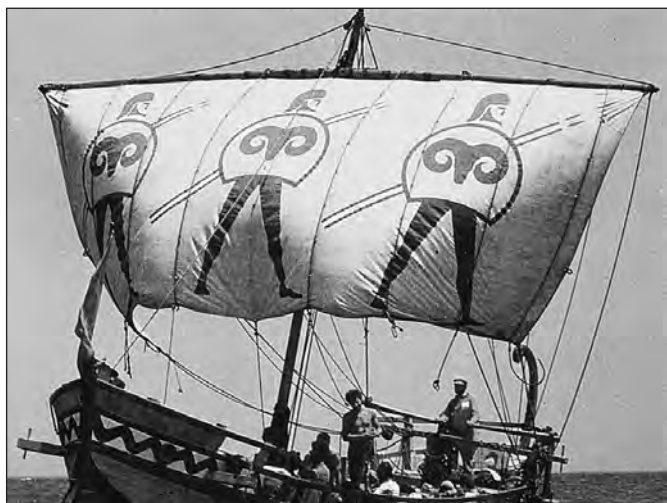
Грецька пентеконтера «Арго»

З часом кораблі вдосконалювали, і їх називали за кількістю рядів весел: монера, діера і тріера – 1, 2, 3 ряди весел відповідно. (Або на римський манір – унірема, бірема і трирема). Подальші нарощування рядів весел залишаємо паперовим реконструкторам. Однак фантазійні чотири-, п'яти- і навіть шестирядні галери навряд чи існували – такими довгими веслами просто неможливо гребти, вони не дістануть до води. До того ж, нам відомі назви лише трьох рядів гребців: франіти, зігіти і таламіти. Тож три ряди весел, мабуть, і були найбільшою можливою кількістю. Усі подальші модифікації стосувалися не весел, а гребців – посади на кожне весло тріери по два гребці й отримаєш гексеру.