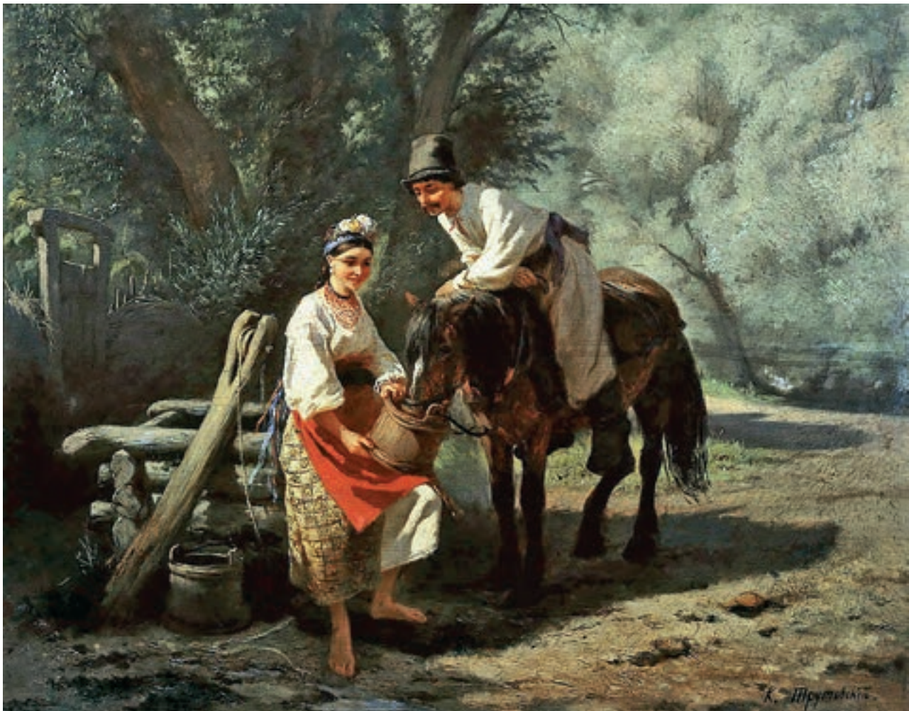
К. Трутовський. «Біля колодязя»

Кав'ярня , і, жін. Невеличкий ресторан, де подають відвідувачам каву, чай, закуски тощо; кафе.