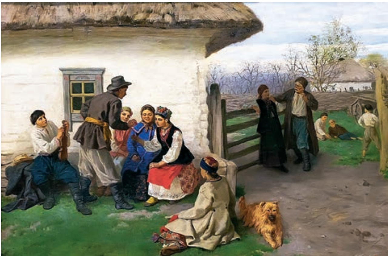
К. Трутовський. «Великдень в Україні»

Ступінь — 1. Порівняльна величина, що характеризує розмір, інтенсивність чого-небудь. Ступінь очищення . 2. Посада, звання, ранг, категорія, вища кваліфікація. Диплом другого ступеня . Учений ступінь доктора філологічних наук . 3. Горизонтальний виступ сходів, на який ступають, піднімаючись угору чи спускаючись униз; сходина . 4. Взагалі рух ногою вперед, убік або назад. 5. Переносно етап, стадія розвитку чогось; фаза , щабель . 6. Складова частина ракети, яка після згоряння в ній палива відокремлюється в польоті. 7. Будь-який звук музичного звукоряду, гами , ладу .