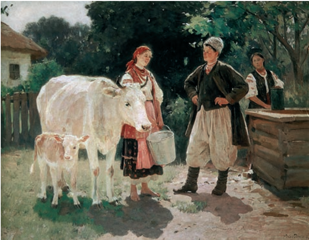
М. Пимоненко. «Суперниці (Біля криниці)»

Пароніми, як і омоніми, у художній літературі та в побуті використовуються для створення каламбурів — жартівливої гри слів: «Сумніваюсь, чи ти козак чи кізяк, — засміявся задоволений своїм жартом Варчук» (М. Стельмах). «Страшніш від огненних геєн голодна хіть зажерливих гієн» (Б. Олійник). «Прийомний син барона був баран» (Л. Костенко). Нечесну приватизацію в народі називають «прихвятизацією»; донощиків, що на вухо доносять, іменують «Навуходоносорами» (за ім'ям вавилонського царя Навуходносора). Використання омонімів і паронімів як художніх та стилістичних засобів називається парономазією.