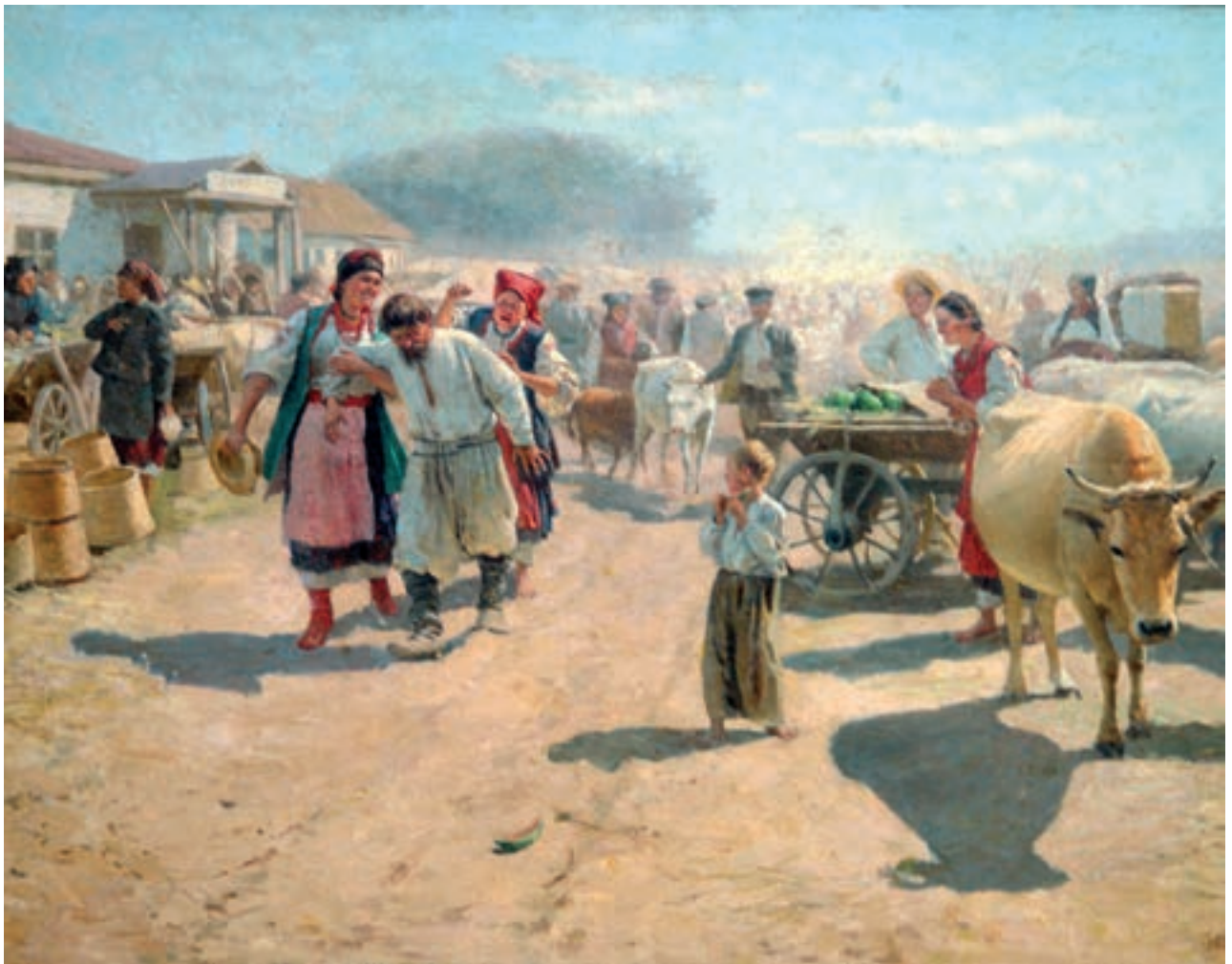
М. Пимоненко. «З базару»

Міграція — 1. Переселення народів усередині країни або за її межі; переміщення капіталу тощо: соціальна міграція, міграція населення, міграція грошей . 2. У біології — пересування