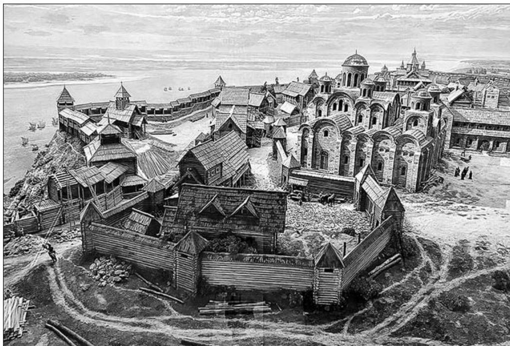
Київ у X столітті. Реконструкція. Київський археологічний музей, диорама «Київ. Місто Володимира». Автор С. М. Половко. Суспільне надбання

Чи означає це, що Києву варто переглянути офіційну дату свого заснування, відкинувши радянську за своїм походженням версію. І якою, в такому разі, має бути нова дата — 430, 862, 882, 887, 944, 948 чи може якийсь інше рік?