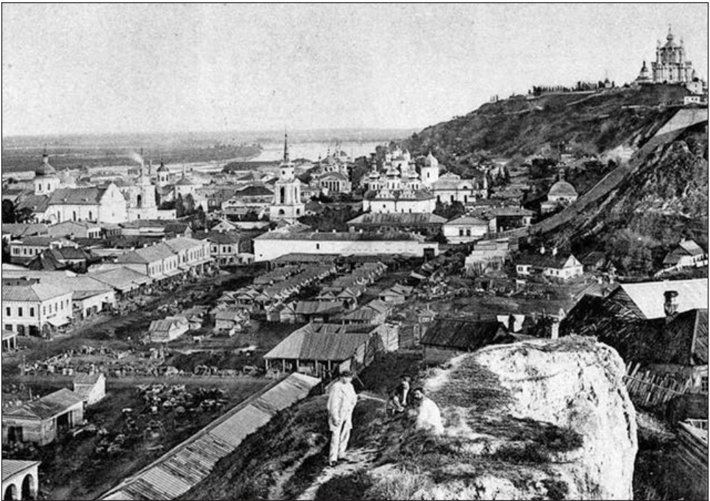
Житній ринок у Києві. Фото кінця XIX сторіччя

Саме тому ми й не можемо визначити «дату народження» Києва тим способом, який застосовують щодо багатьох інших міст, за першим згадуванням у джерелах. Адже тогочасних джерел ми просто не маємо. А якщо в створеній через кілька століть «Повісті минулих літ» Київ і справді згадано в запису за 862 рік (разом з п'ятьма-шістьма іншими поселеннями), у той час, як запис за наступний