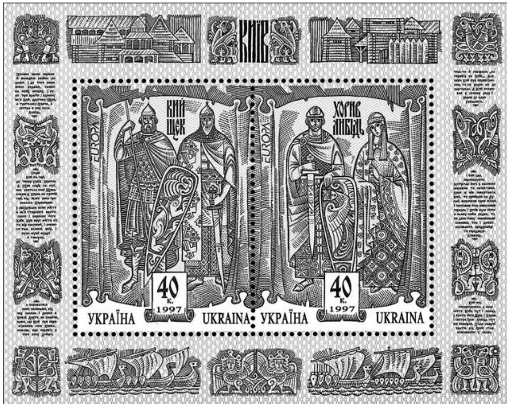
Легендарні київські князі Кий, Щек, Хорив і їхня сестра (Поштова марка. 1997 рік)

Легенду про заснування Києва чи не кожен народжений в українській столиці пам'ятає з дитинства. «І були три брати: одному ім'я Кий, другому — Щек, а третьому — Хорив, а сестра в них була Либідь...». От тільки коли саме вони «були»? «Повість минулих літ», звідки ми й знаємо цю легенду, не повідомляє. Чому? Адже йдеться саме про літопис — тобто хроніку подій, розписану по роках.