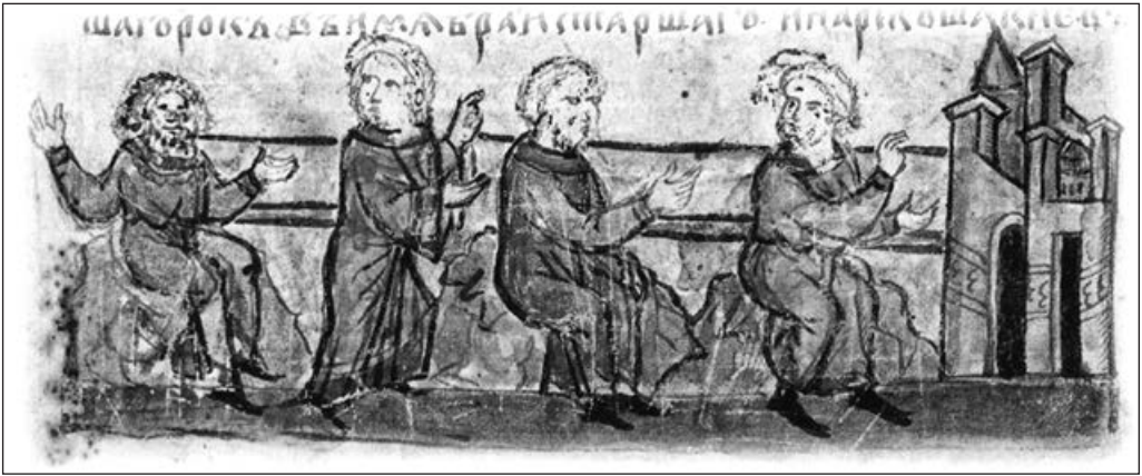
Кий, Хорив, Щек. Радзивілівський літопис. XV ст.

Вочевидь навіть для автора «Повісті», написаної аж в XII сторіччі, часи Кия були настільки давніми, що й приблизну дату він назвати не міг (хоча насправді й чимало інших подій у ній позначені конкретними роками мало не навмання).