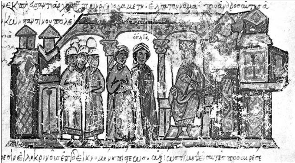
Імператор Костянтин VII Порфірогенет приймає княгиню Ольгу в Константинополі. Радзивіллівський літопис. XV ст.

в «літописанні грецькому». Це зізнання, яке вражає наївною відвертістю, але водночас дозволяє зрозуміти саму механіку створення найдавніших руських хронік. Як не прикро, можливо, це буде визнати, але вся літописна хронологія перших сторіч існування Русі є запозиченою! Запозиченою саме з візантійських джерел: у «Бертинських анналах», скажімо, Русь була згадана ще під 839 роком, але літописець «Повісті...», вочевидь, був з ними незнайомий.