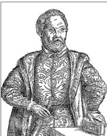
Мацей Стрийковський. 1582 р.