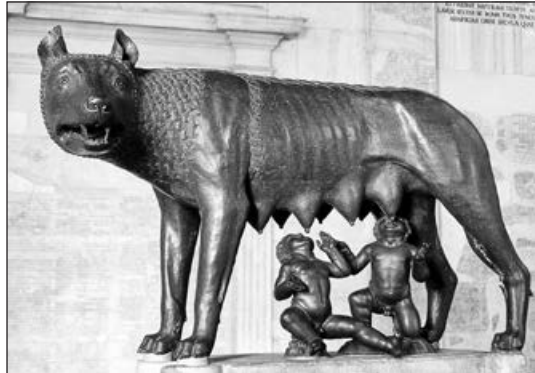
Капітолійська вовчиця, символ заснування Рима. Бронза. V століття до н. е. Автор невідомий

визначається зовсім не цим. Коли б не виник Київ, він завжди був не просто центром, а серцем нашої країни. І тоді, коли за нього боролися власні князі, і коли на нього зазіхали зовнішні вороги. Навіть у руїнах, залишених Батиєм і Менглі Гераєм. Гетьмани мали власні резиденції, що мандрували українськими землями, але Київ залишався Києвом. Більшовики, звісно, могли оголосити столицею УРСР Харків, нацисти могли розмістити свою адміністрацію у Рівному, але де більшовики з нацистами зараз?