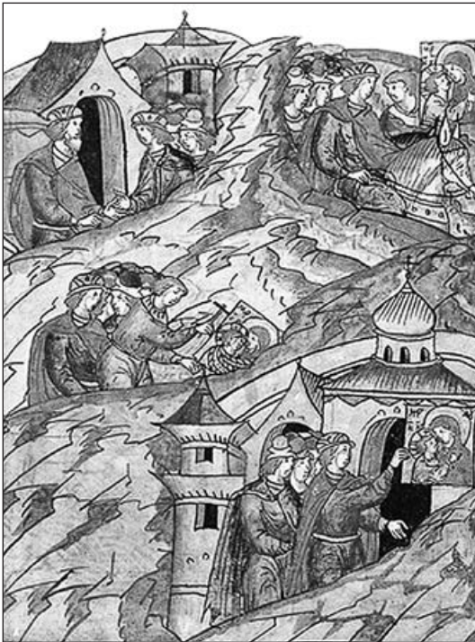
Андрій Боголюбський краде Вишгородську ікону, прагнучи утвердити першість свого князівства. Мініатюра XVI ст.

Коли постала російська держава, її володарі прагнули обґрунтувати свої претензії на Київ та київську спадщину. А їхні опоненти — довести, що ці претензії безпідставні. Потім додалося бажання мак-