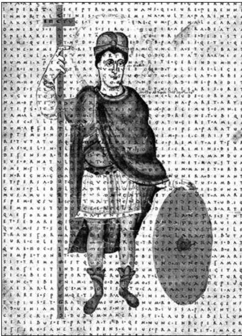
Імператор Людовик Добродушний, до якого прибули представники русів у 839 році. Ватикан, Апостольська бібліотека, Codex Reg. lat 124, f.4v

Оскільки дата була затверджена на найвищому рівні, шукали її підтвердження і в письмових джерелах, але «здобич» навряд чи можна було назвати винятковою. Скажімо, у вірменській «Історії Тарона» початку VII сторіччя знайшли схожу легенду про трьох братів — можливо, запозичили її у мешканців Наддніпрянщини? Так