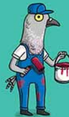
ПЕТР ГОЛУБІНЧИ МАЛЯР

Агата Крісі допитала чотирьох підозрюваних. Кожен пояснює, що робив у момент крадіжки.