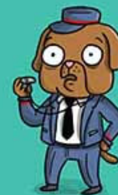
ПЕРЕТОРНІ, ЩОБ ЗАВЕРШИТИ СЛІДСТВО.

Із цього потяга вийшли лише дві пасажирки, але ніхто не захопив.