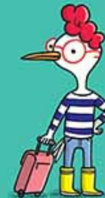
МАРТА ЧАЙКА МАНДРІВНИЦЯ

На час крадіжки я перефарбовував вокзал.