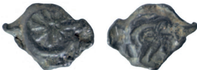
Іл. 8–9. Пломба з зображенням рози та лева XIII ст.

На пломбах дорогичинського типу XIII ст. роза фігурує в найрозмаїтіших видозмінах, найчастіше ж — із вісьмома загостреними пелюстками 36 . Іноді зображення рози поєднано з фігурою лева (геральдичним знаком Мономаховичів) 37 або галкою (гербом Галицької землі) 38 , що дозволяє атрибуувати ці пломби XIII ст. саме Романовичам.