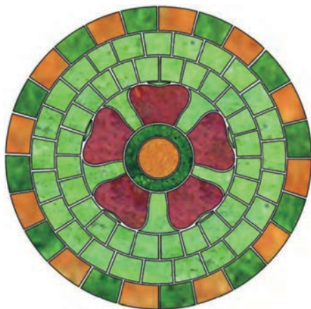
Іл. 1. Зображення рози на керамічній полив'яній плитці з вежі в Столп'є середини XIII ст.

Знак із фігурою рози вже від XI ст. побутував у всіх головних відгалуженнях руського княжого Дому. Про це детально йшлося в III розділі I тому цього дослідження. Слід лише нагадати, що для відмінювання загальнодинастичного герба окремими гілками роду та його особними представниками вживано різне забарвлення головної фігури та поля щита, або ж використання додаткових фігур (бризур) чи поділів гербового поля. У старшій лінії Мономаховичів упродовж XII ст. вдавалися до всіх цих прийомів.