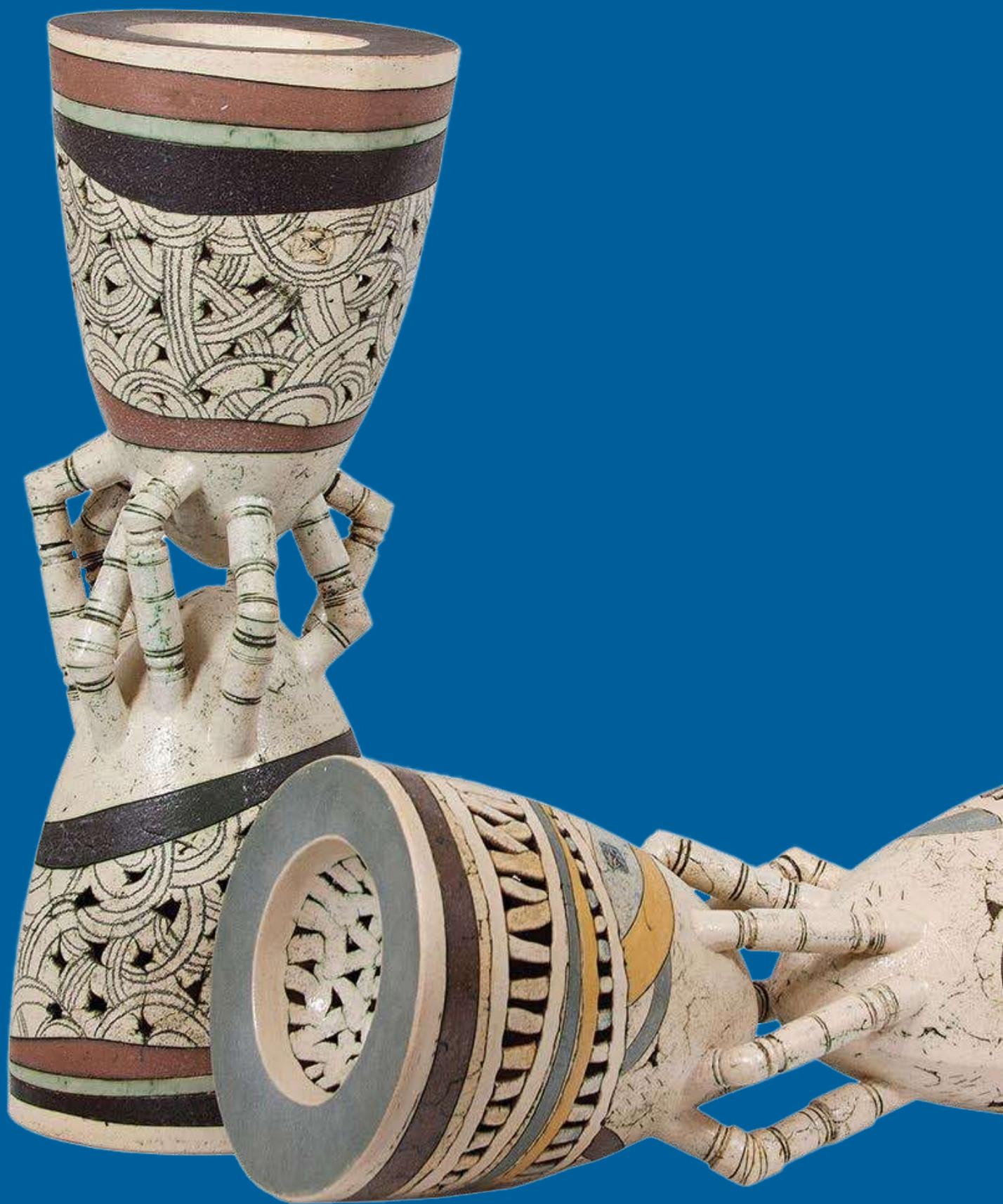
1. В. Хижинський. Час I. Час II / V. Khyzhynskyi. Time I. Time II. 2016