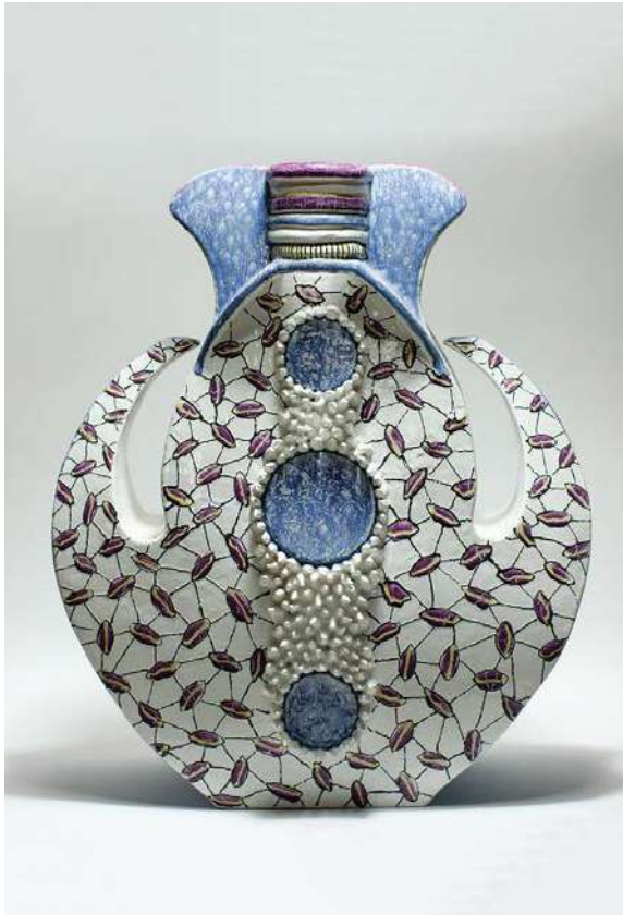
2. О. Дворак-Галік. Подих води O. Dvorak-Halik. Breath of Water . 2014