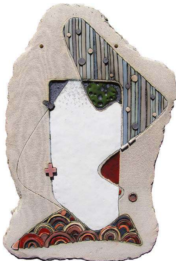
11, 12. Ю. Войтович. Із серії "Гейша" / Yu. Voytovych. From the "Geisha" series. 2017