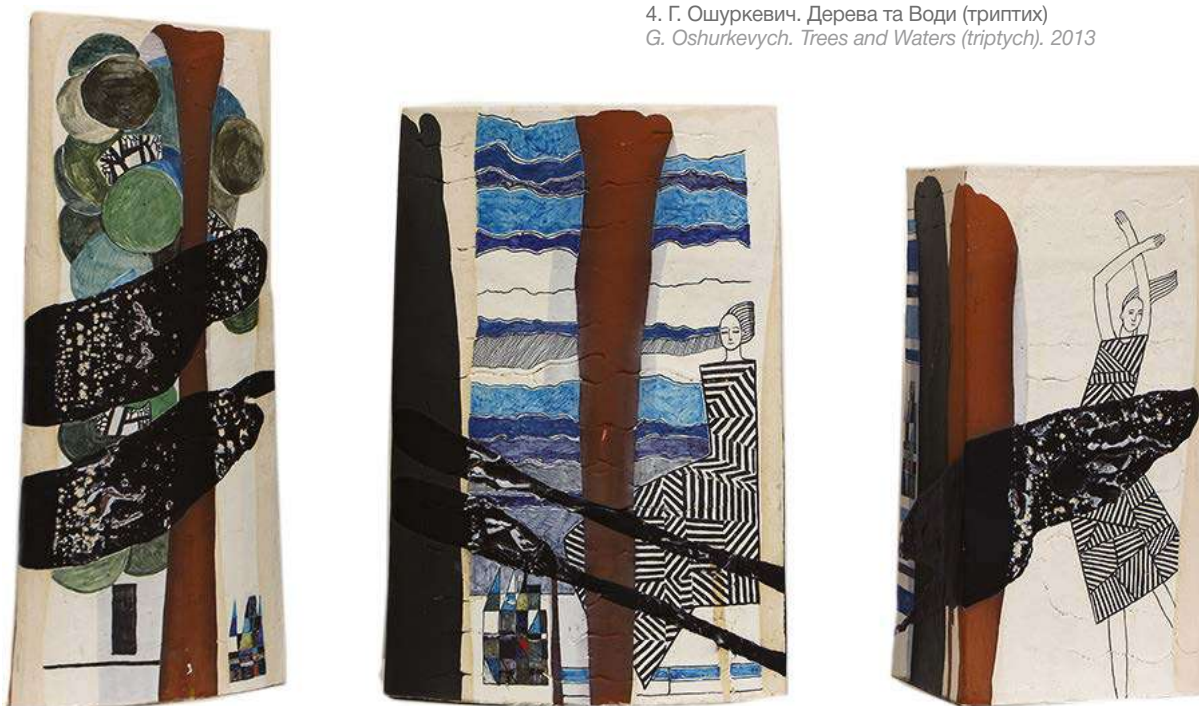
4. Г. Ошуркевич. Дерева та Води (триптих) G. Oshurkevych. Trees and Waters (triptych). 2013

Professional art ceramics of the 1990s – 2010s period is a multivariant phenomenon, which is formed on the