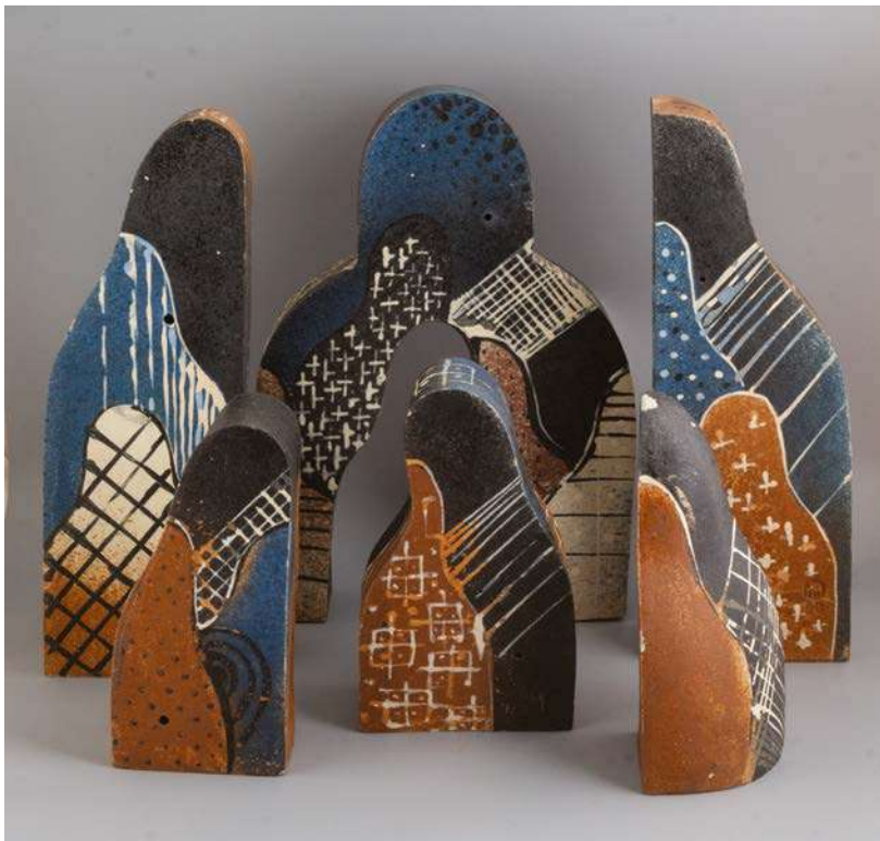
10. О. Міловзоров. Складень O. Milovzorov. "Folding Icon". 1990