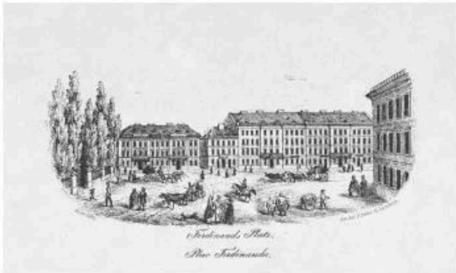
■ Пл. Фердинанда (пізніше Марійська), малюнок 1846 р.