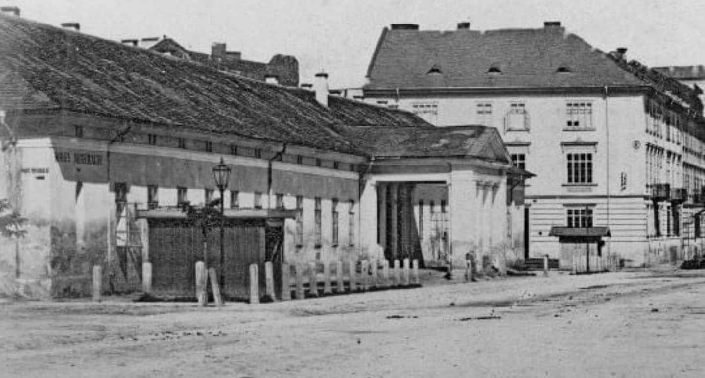
■ Казино Гехта, 1860-ті

повнені. В Англійському готелі понад сто покоїв – і всі зайняті. Ледве знайшовся для мене один pokій – та й той поганий, бо вологий. Одразу ж явився до мене жид-фактор і запропонував свої послуги. В кожному готелі тут є швейцар і кілька факторів».