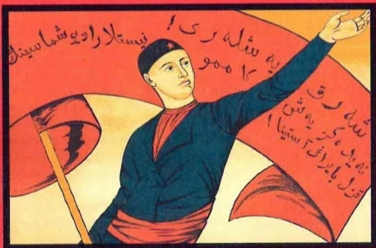
Плакат татарською мовою. Напис: «Молодь Сходу! Ставай під червоний стяг організації молодих комуністів!». 1921 рік.