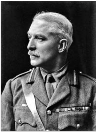
Джордж Кайнастон Кокерілл

новано на секцію МО-3, вона при цьому втратила дві підсекції, що займалися картографією. Утім, процес виведення картографів зі складу розвідки був характерний для армій усього світу, в яких раніше чи пізніше організовувались окремі картографічні служби. У складі МО-3 залишилися підсекція «особливих завдань» і бібліотека, якими керував майбутній директор військової розвідки Джордж Кокерілл.