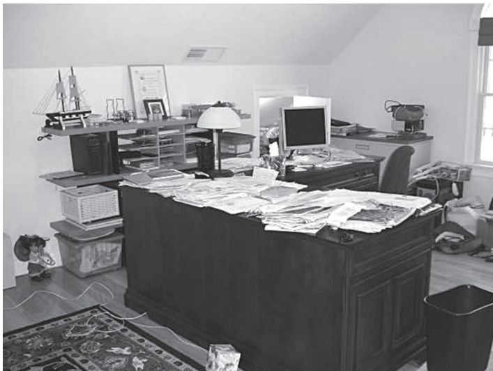
Рис. 12.1. Офисный беспорядок.

Она открывала дверь в офис только для того, чтобы забросить туда какие-то вещи и быстро ее закрыть. А как вы чувствуете себя в своем офисе? Вы должны чувствовать себя сильным. Что для вас означает быть сильным применительно к вашему офису или рабочей среде?