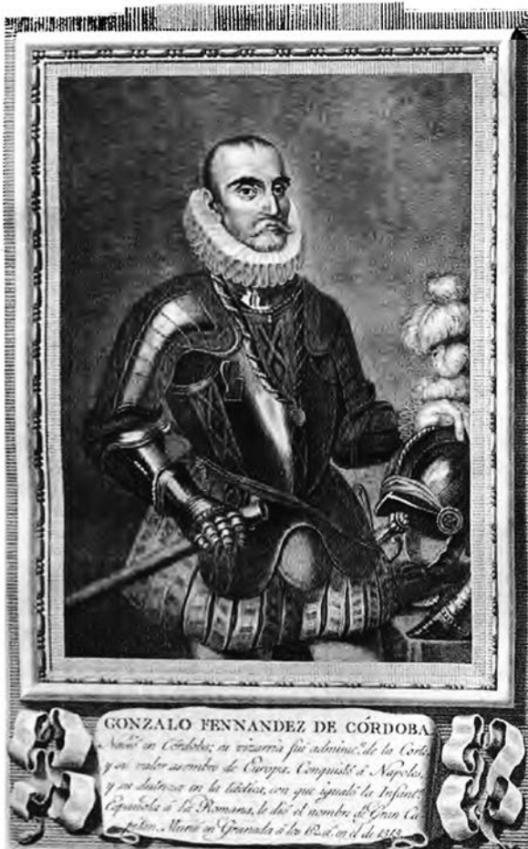
Гонсало Фернандес де Кордова

Іспанська піхота. Основою успіху іспанського війська була іспанська піхота, яка домінувала на полях битв Європи протягом середини XVI — середини XVII ст. Своєрідним поєднанням практик швейцарської баталії, полків ландскнехтів та римських легіонів стала іспанська терція (1534—1704), запроваджена кондотьєром Гонсало Фернандесом де Кордовою на завершальній стадії Італійських війн. Офіційно терція була запроваджена у 1536 р. генуезьким ордонансом короля Карла V замість баталій і коронелій . Терція (tercio) передбачалася у складі 12 рот. Десять рот пікінерів мали у своєму складі по 3 офіцери, 8 унтер-офіцерів, 219 пікінерів (половина з яких була без доспівів) і 20 мушкетерів. Дві роти аркебузирів мали по 3 офіцери, 8 унтер-офіцерів, 224 аркебузира та 15 мушкетерів. Всього в терції з командиром було 3001 чол., в т. ч. офіцерів — 37, унтер-офіцерів — 96, пікінерів — 2190, аркебузирів — 448, мушкетерів — 230. Терція була одночасно і бойовим порядком: три лінії розташовані на зразок римських легіонів у шахматному порядку (дві баталії у першій та третій лініях і