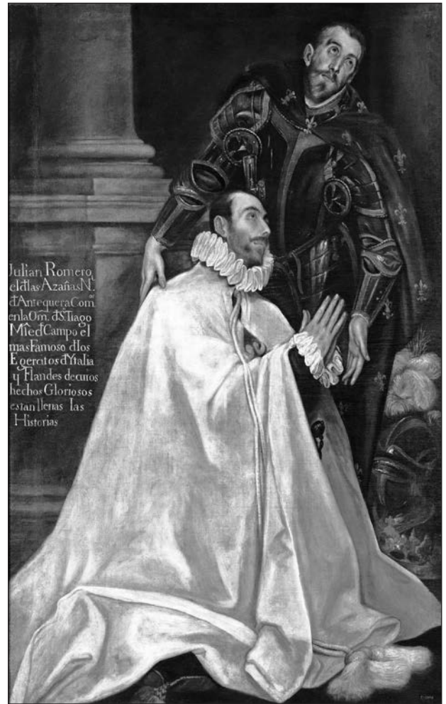
Джуліо Ромеро де Ібаррола зі святим патроном. З картини Ель Греко

Джуліо Ромеро де Ібаррола (1518—1577) пройшов шлях від рядового піхотинця до командира терції (маестро де кампо). Від-