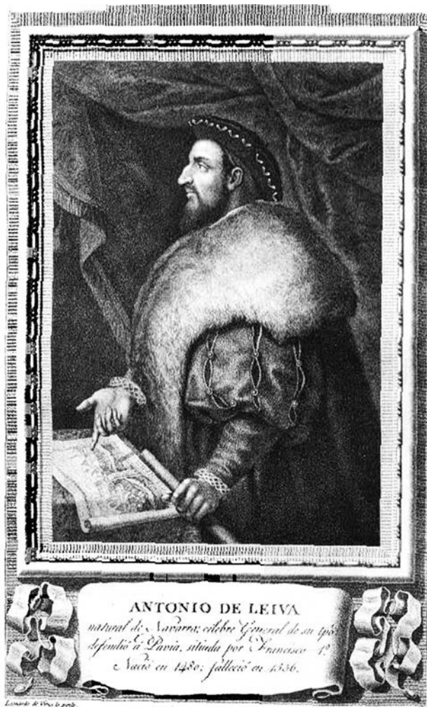
Антоніо де Лейва

Антоніо де Лейва (1480—1536), князь Асколі, герцог Терранова. Розпочав військово кар'єру у 1502 р. на війні з повсталими мудехарами в колишньому Гранадському еміраті. З 1503 р. воював у Іспанії під командуванням Гонсало Фернандеса де Кордова, відзначився у битвах при Равенні (1512) та Павії (1525), з 1525 р. — командуючий імперським військом у Міланському герцогстві, з 1535 р. — губернатор Мілану 2 ;