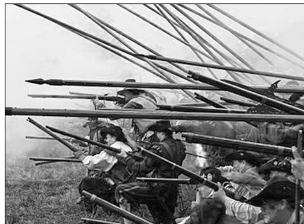
Іспанська терція в бою. Історична реконструкція

класична наймана армія, а дисципліноване військо з високим моральним духом 1 .