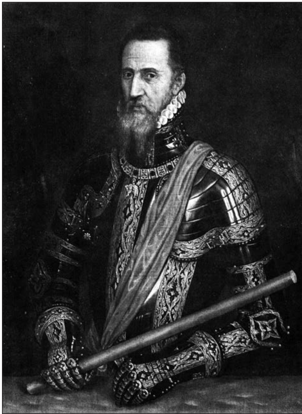
Альба Фернандо Альварес де Толедо. Портрет роботи Тиціана

зокрема при Йегуї 21.07.1568 р. (У герцога Альби було 12 тис. піхоти, 3 тис. кавалерії та кілька гармат, Людовик д'Оран д'Насау мав 10 тис. піхоти, 2 тис. кінноти та 16 гармат, долю битви вирішила артилерія іспанців і їх знаменита терція . Іспанці втратили 80 вбитими і 220 пораненими, голландці — до 7 тис. Але відсутність флоту і поразки від морських гезів змусили Альбу просити відставки. Завоював Португалію (1580) і був там віце-королем (1580—1582). Герцог Альба навчив свою легку кавалерію атакувати у зімкненому строю 5—8 шеренг 4 ;