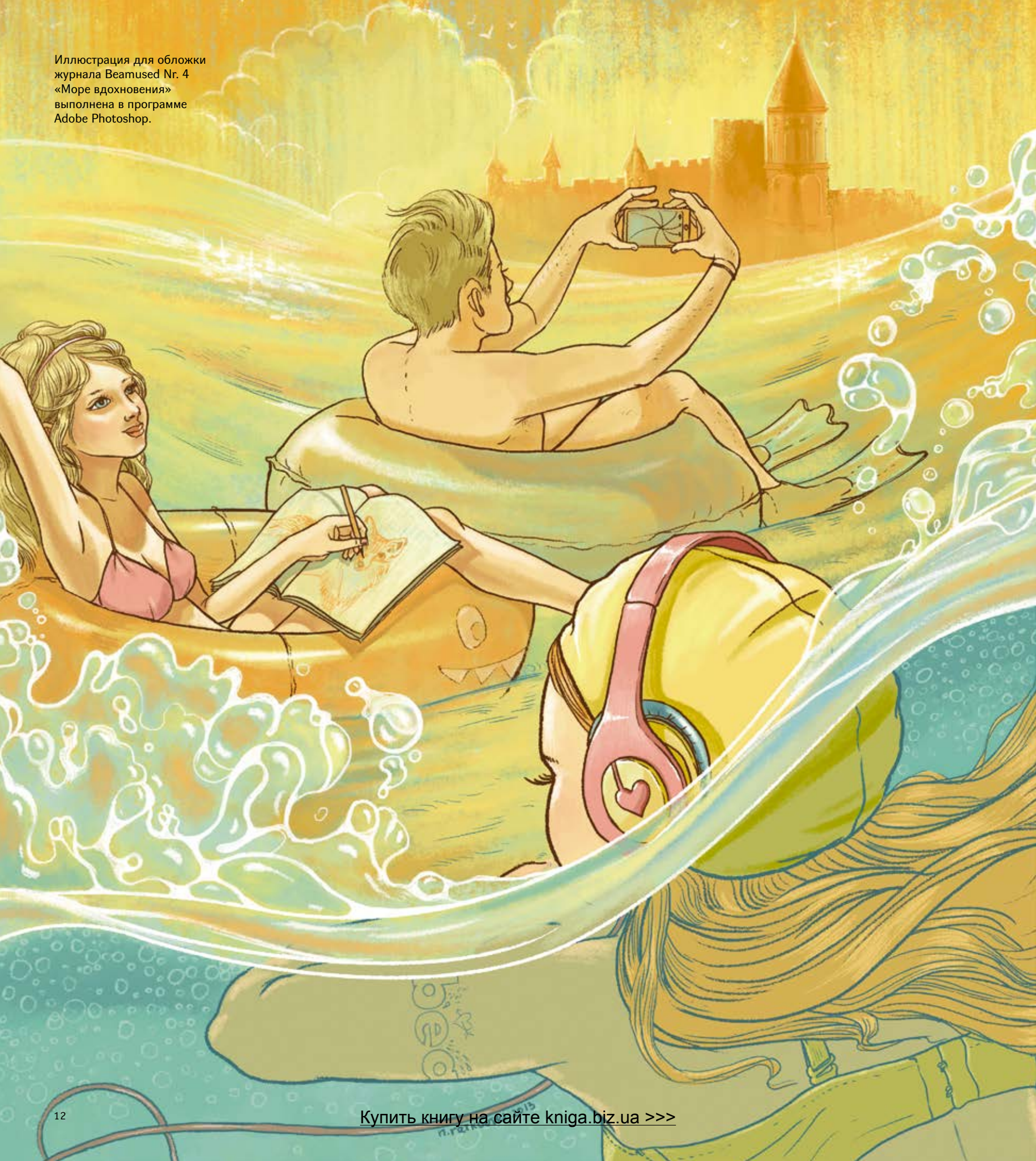
Иллюстрация для обложки журнала Beatused Nr. 4 «Море вдохновения» выполнена в программе Adobe Photoshop.