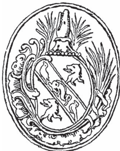
Печатка Бенджаміна Франкліна