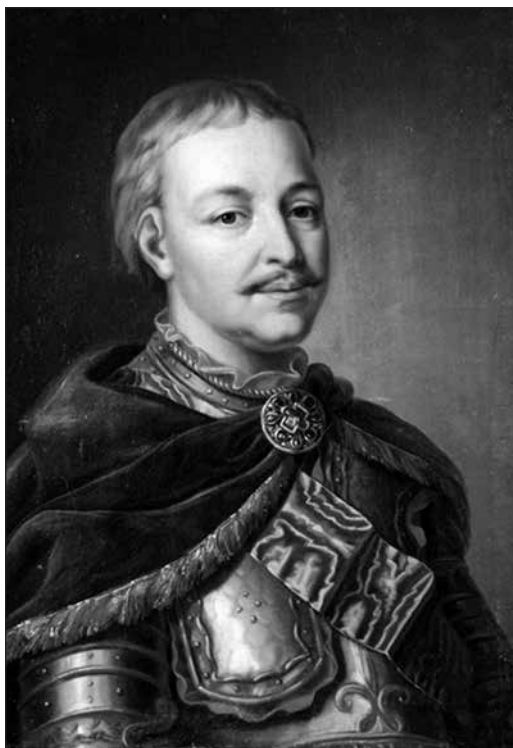
Портрет Івана Мазепа. Дніпровський художній музеї

Гетьман Іван Степанович Мазепа походив з українського шляхетського роду Мазеп-Колединських (інший варіант написання — Колодинських) православного віросповідання. Невідомий автор «Літопису Самовидця» твердив, що Мазепа зі «старожитної шляхти української і у Війську Запорозькому значної», а інший відомий український літописець кінця XVII—початку XVIII століття, Самійло Величко, називає гетьмана «значним козако-руським шляхтичем». На жаль, історики й сьогодні не мають точних даних, звідки походив рід Мазеп-Колединських. Олександр Оглоблін у своєму класичному дослідженні, присвяченому гетьманові Мазепі та його добі, згадує про версії волинського та подільського походження роду. На користь останньої говорить і той факт, що в XVII столітті на Поділлі (у Барському старостві) проживав рід Мазеп-Васютинських, які, можливо, були далекими родичами Мазеп-Колединських. Загалом же прізвище «Мазепа» було не таким уже й рідкісним на Правобережжі і до, і після гетьманування Івана Степановича, причому як у написанні «Mazepa» (саме таким чином завжди писав своє прізвище гетьман), так і «Mazerra» або навіть «Maziera». Люди з таким прізвищем фігурують у документах XVIII—XIX століть, а в XX столітті Ісаак Мазепа — відомий український політик (не родич гетьмана) — навіть встиг побути прем'єр-міністром УНР доби