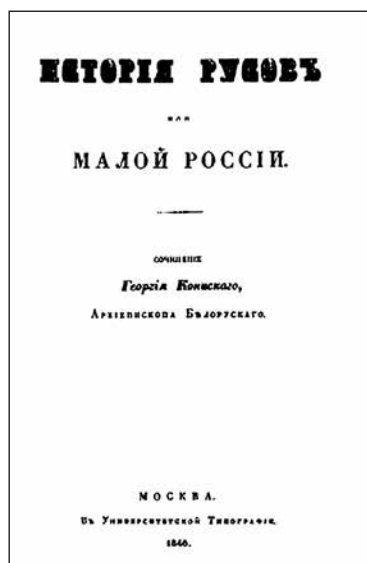
Обкладинка книги «Історія Русів»