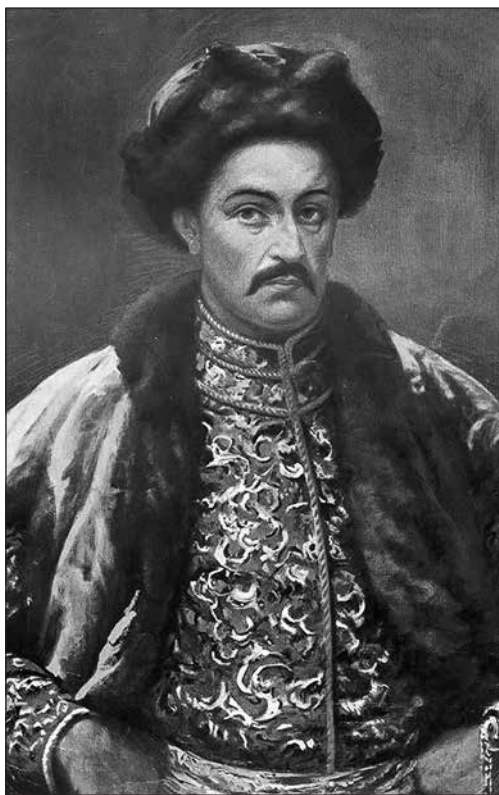
Осип Курилас. Портрет Івана Мазепа. 1909 р.

Поза всяким сумнівом, Іван Степанович Мазепа-Колединський є однією з найяскравіших, найвидатніших і найсуперечливіших постатей української історії. Крім того, що ця постать визначна за своїм масштабом — політичний діяч, військовий, дипломат, меценат, — мало кому в українській історії випала така цікава й непроста доля за життя та після смерті. Іван Мазепа — одна з тих знакових особистостей, чиє життя та вчинки і сьогодні викликають гарячі суперечки як фахових істориків, так і аматорів, а нерідко — і людей, взагалі далеких від історичних перипетій. Характерно, що вже понад триста років, як помер гетьман, а він і сьогодні викликає найрізноманітніші, полемічно загострені, полярні оцінки — «зрадник російського царя», «зрадник і ворог українського народу», «польський шляхтич і таємний католик», «романтичний герой», «видатний патріот України», «непримиренний ворог московського імперіалізму» тощо. Що-що, а забуття (як не пригадати пушкінське, з «Полтавы» — «Збыт Мазепа с давних пор...») гетьманові не загрожуватиме ще дуже довго. Здається, в постаті Івана Мазепа втілюється самий дух неспокійної, кипучої, напрочуд колоритної доби, котра недаремно дістала у мистецтвознавців назву «бароко» (від итал. barocco — «дивний», «хімерний»). І справді. Приятель царя Петра, один із перших кавалерів найвищого російського ордена Андрія Первозванного — і борець за інтереси Української козацької держави; будівничий величних соборів, що дотепер є окрасою багатьох