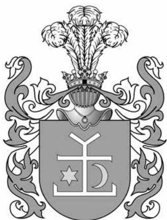
«Курч» — герб Курцевичів

праворуч). Проте відомо, що в Речі Посполитій сотні, а інколи й тисячі шляхтичів (які становили до 10 відсотків населення, тоді як у будь-якій іншій тогочасній країні Європи дворянство становило не більше 0,5—1 відсотка) могли користуватися фактично тим самим гербом (або його варіаціями — так званою odmiana ), навіть не будучи спорідненими між собою, а просто перебуваючи на службі у аристократа — носія герба. Цілком можливо, що десь у першій половині XVI століття котрийсь із князів Курцевичів, які проживали на Білоцерківщині, прийняв предка гетьмана Мазепа до свого родового герба «Курч». На думку М. Костомарова (що посилається на не зовсім перевірені дані графа де Броель-