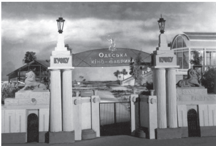
Так виглядав 1922 року головний вхід на територію Першої кінофабрики ВУФКУ в Одесі. Макет з нагоди святкування 50-річчя Одеської студії

Тому ВУФКУ ухвалило рішення об'єднати три структури в одну потужну — не лише юридично, але й територіально. Головним майданчиком визнали колишню кінофабрику Харитонова: по-перше, там відновлений величезний знімальний павільйон, по-друге, вона