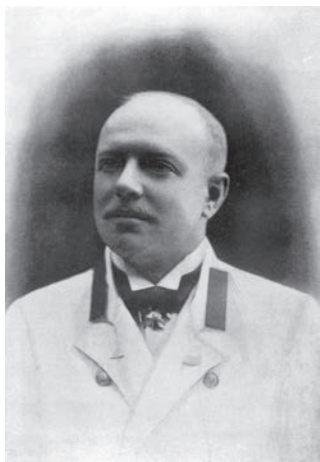
Юрій Давидов — офіцер, землевласник, мемуарист. У 1918 р. став біля витоків української кіноосвіти

Урядовий дозвіл на відкриття «Студії екранного мистецтва» одержав відомий громадський діяч, один з ініціаторів заснування Київської консерваторії Юрій Давидов, племінник видатного композитора Петра Чайковського. Студія відкрилася в Києві 6 жовтня 1918 року у великій квартирі Давидова по вул. Рейтарській, 13. У цьому мешканні, до речі, одного разу побував гетьман Скоропадський — можливо, був присутній на урочистому відкритті.