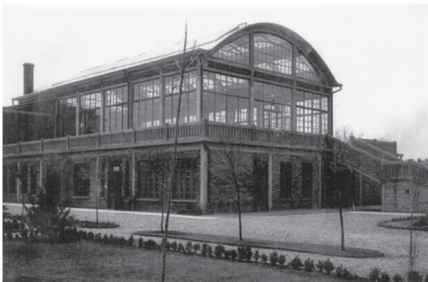
Головний павільйон Першої кінофабрики ВУФКУ (Одеса), він же «павільйон № 1», він же — «харитоновський». Тут 1922 року знято перший ігровий фільм ВУФКУ «Шведський сірник»