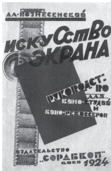
Один з перших в Україні посібників у галузі кіно

Скоропадський зажадав від прем'єр-міністра Федора Лизогуба розглянути інформаційне питання. Відбулося кілька засідань уряду, присвячених розвитку українських мас-медій. Ухвалили: придбати в Києві великий будинок і заснувати в ньому Палац преси.