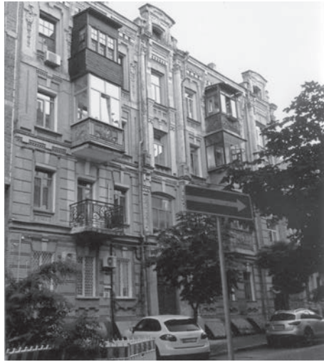
Перша штаб-квартира українського державного кінематографу — «прабабуся» сучасного Держкіно — містилася в Києві на вул. О. Гончара, 25. Правління АТ «Українфільма» збиралося в кв. 15.

Якщо стрічка дістане прокатний дозвіл, Кінематографічна секція покаже її власникам кінотеатрів і, відповідно до кількості