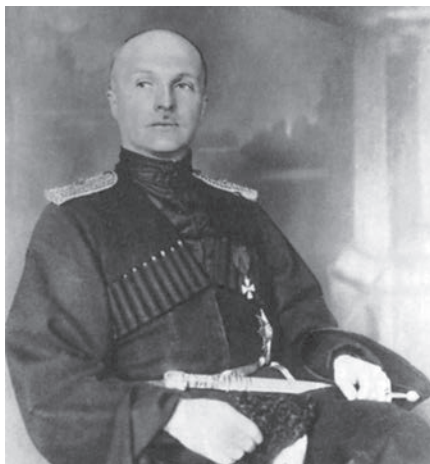
Гетьман Павло Скоропадський першим втілював модель державного кінематографу

Київ, 1918 рік. З кінця квітня на чолі держави — гетьман Павло Скоропадський. Вже понад рік тривають Визвольні змагання. Кілька місяців тому червона Росія атакувала Українську Народну Республіку, тимчасово захопивши столичний Київ, і є загроза, що зробить це знову. До того ж буяє інфляція, періодично змінюються міністри, державна скарбниця майже порожня, борги уряду