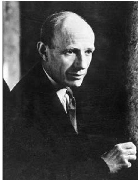
Едвард Фредерік Ліндлі Вуд, 1-й граф Галіфакс

У цей критичний час британський прем'єр переживав особисту трагедію краху створеної ним «мюнхенської» системи, і ця мала біда значною мірою заступила для нього велику біду всього народу. Навіть у промові з приводу початку війни в Європі він не забув поскаржитися: «Усе, заради чого я працював, усе, на