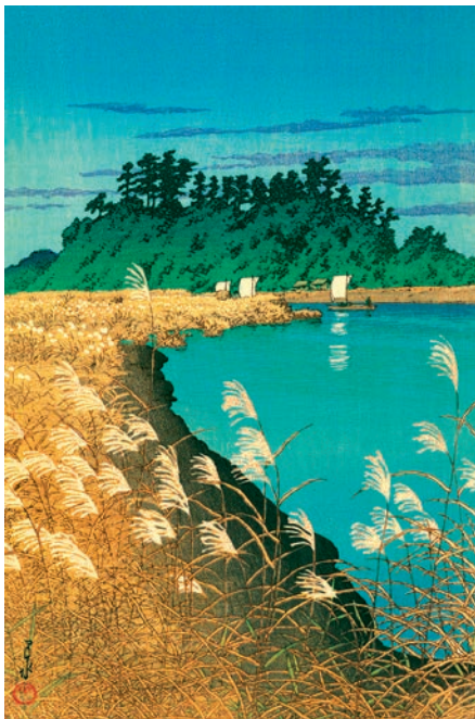
Кавасе Хасуї (1883–1957).