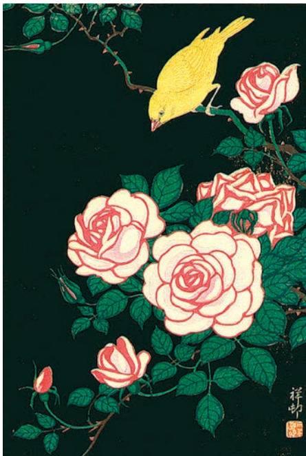
Охара Косон (1877–1945).