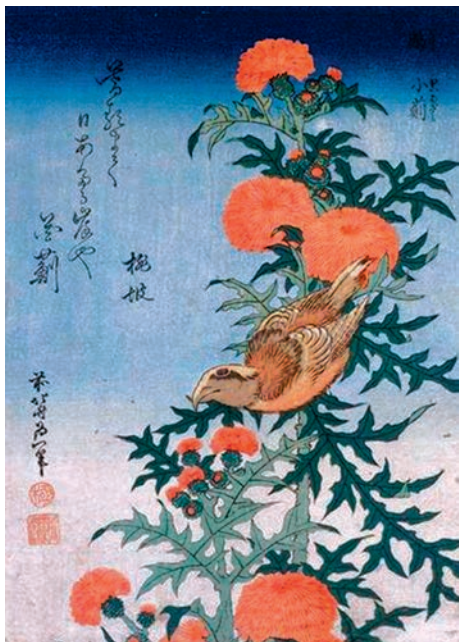
Кацшїка Хокусай (1760–1849).