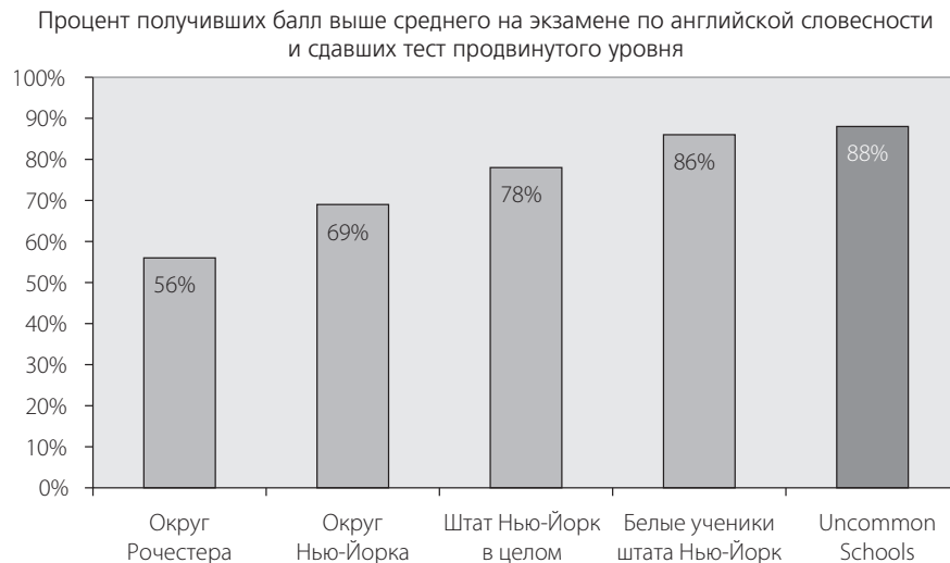
Рис. В.1. Совокупные результаты по английской словесности, 3–8-й классы