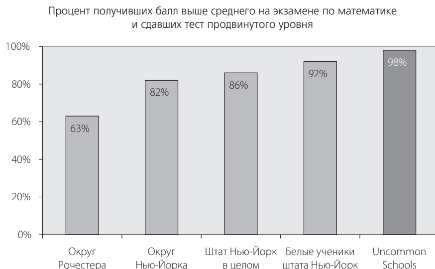
Рис. В.2. Совокупные результаты по математике, 3–8-й классы