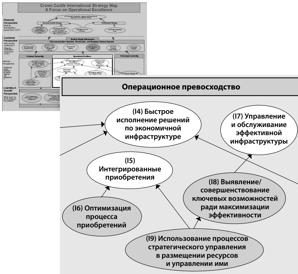
Рисунок 1. Стратегическая карта Crown Castle крупным планом

Поскольку наша корпоративная культура в целом — внутренние системы, показатели, вознаграждения — строилась на стратегии, ориентированной на приобретения, необходимо было найти инструменты внедрения стратегии операционного превосходства и управления ею.