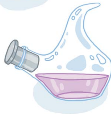
Колбы бывают разными!