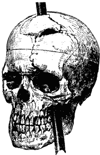
Рис. 3. Рисунок врача, показывающий, в каких местах черепа Финеаса Гейджа вошел и вышел железный лом*

Еще не так давно ученые полагали, что ничего хорошего в ней нет вовсе, поскольку люди, у которых лобная доля была повреждена, казалось, прекрасно обходились и без нее. Финеас Гейдж, работавший мастером на Рутландской железной дороге, как-то раз прекрасным осенним днем 1848 г. устроил небольшой взрыв, в результате чего метровый железный стержень угодил Финеасу прямо в лицо. Стержень вошел в левую щеку и вышел через верх черепа, проделав в нем изрядную дыру и отхватив значительную часть лобной доли (рис. 3). Финеас упал наземь