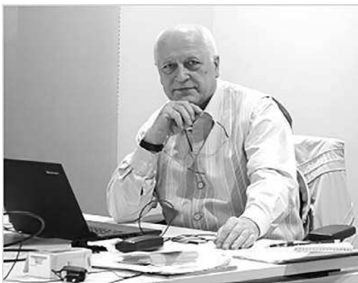
Центр Технического Университета Берлина в Эль Гуна (El Gouna), Египет, 20 января 2016

профессор, доктор технических наук по двум специальностям (Системы автоматизированного проектирования и Элементы и устройства вычислительной техники и систем управления); работа была защищена в 1993 году в Институте Точной Механики и Оптики (ИТМО), Санкт-Петербург, Россия; сооснователь, содиректор и научный руководитель Академии Инструментальной Модерн ТРИЗ (АИМТРИЗ, 2000 г., Берлин, Германия), главной образовательной деятельностью которой является дистанционное обучение основам Модерн ТРИЗ на базовом и продвинутом уровнях; основатель направления Модерн ТРИЗ (с 1995 г.), автор образовательных МТРИЗ-методик и моделей «Экстрагирирование», «Реинвентинг» и «Мета-Алгоритм Изобретения (МАИ) Т-Р-И-З».