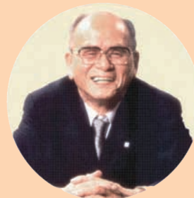
г-н Тору Кумон Основатель Kumon