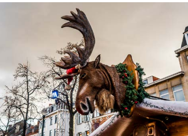
▲ Рождественские рынки в европейских городах работают с конца ноября по конец декабря

РОЖДЕСТВО — СЕМЕЙНЫЙ ПРАЗДНИК, ТАК ЧТО 25 И 26 ДЕКАБРЯ ВЫ, ОКАЗАВШИСЬ В ЕВРОПЕ, ЗАСТАНЕТЕ ПУСТЫЕ УЛИЦЫ, НЕРАБОТАЮЩИЙ ТРАНСПОРТ И ЗАКРЫТЫЕ МАГАЗИНЫ. ЭТИ ДНИ ЛУЧШЕ ПРОВОДИТЬ ИЛИ ДОМА, ИЛИ В ДОРОГЕ ТУДА, ГДЕ ВЫ СОБИРАЕТЕСЬ ВСТРЕЧАТЬ НОВЫЙ ГОД.