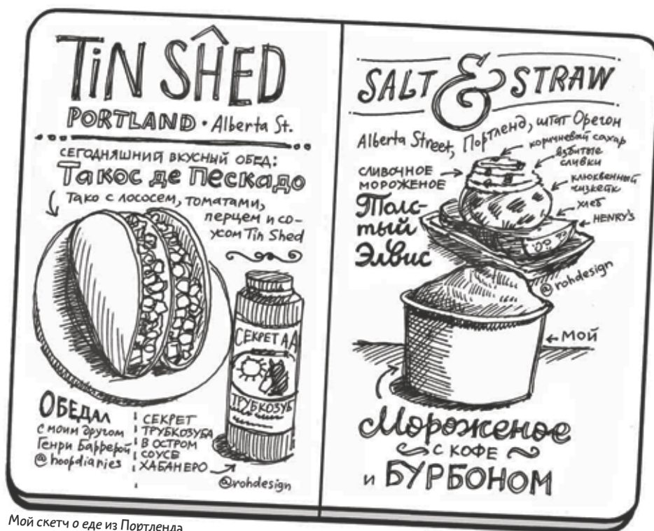
Мой скетч о еде из Портленда

Как дизайнер со стажем я ежедневно использую скетчи для придумывания и фиксации новых идей. На протяжении многих лет я создавал визуальные заметки о еде и путешествиях, и теперь они возвращают меня назад к памятным событиям.